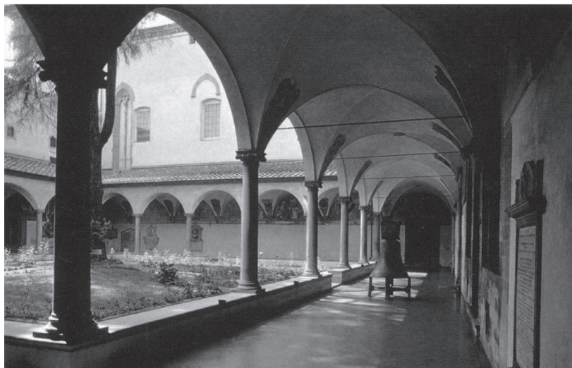
Fig. 10 Interior do Convento São Marco. Fotografia.