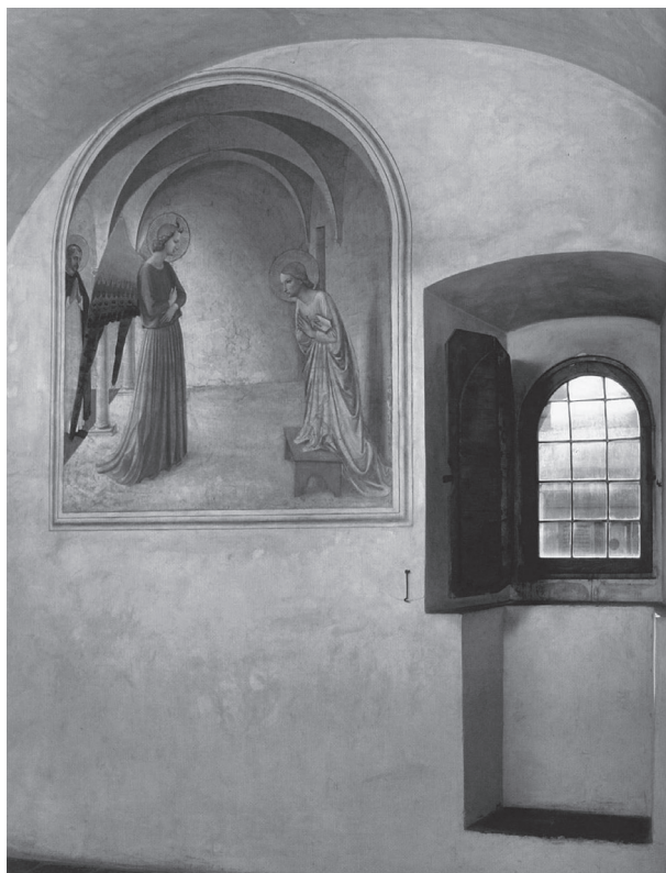
Fig. 12 Janela ao lado do afresco de Fra Angelico – Interior do Convento de São Marco. Fotografia.

A potência do branco explicada pelo filósofo se verifica com maior nitidez quando nos é dito que o afresco está “fixado numa cela” e pintado, propositadamente, “numa contraluz” que sai de uma janela que está ao lado da obra 40 (figura 12). Por esse caminho mais analítico, conseguimos captar o argumento do teórico, pois a escolha de Angelico em figurar um afresco com extremada brancura numa cela em contraluz amplia a força estética do branco, porque, no momento exato em que o observador se encontrar diante do branco do afresco e da luz que vem de fora da janela, ele experimentará uma luminosidade vigorosa em seu olhar que não pode ser reduzida à representação da Anunciação, mas à disponibilidade da arquitetura como um todo. Essa disposição