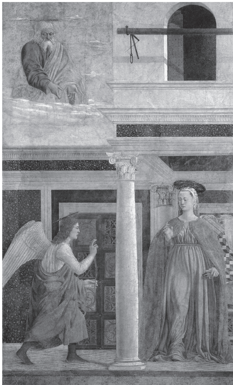
Fig. 7 Piero della Francesca. Anunciação . Afresco, 329 x 193 cm. Basílica de São Francisco de Assis, Arezzo.

ARS Mantegna ou de Uccello. Causa surpresa, o fato de o comentário de ano 14 Didi-Huberman não apresentar qualquer relação mais substancial n. 28 entre as poéticas dos artistas e suas obras.