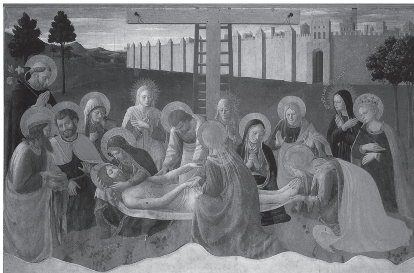
Fig. 2 Fra Angelico. Lamentação sobre o Cristo morto. Têmpera e ouro sobre painel, 109 x 166 cm. Florença, Museu de San Marco.

do de descobertas plásticas, uma importante pesquisa estética. Como nos mostra o historiador, o pintor fez esse aprofundamento plástico em função de operar em mediação constante a descoberta plástica do século XV e a metafísica tomista tão difundida no século anterior. Assim sendo, essa doutrina adentra os quadros do pintor mais na dimensão da forma, não podendo ser lida a partir de cenas de evangelização.