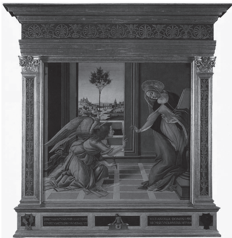
Fig. 4 Sandro Botticelli. Anunciação . Têmpera sobre madeira, 150 x 156 cm. Florença, Galeria dos Uffizi.

No final da passagem, observa-se outra questão acerca do fragmento, mais precisamente na parte em que o historiador francês menciona a falta de pavimentos no afresco de Angelico em comparação com obras de Botticelli e de Piero della Francesca. O modo ligeiro com que o autor lança esse comentário espanta por não haver qualquer alusão analítica acerca da diferença cronológica entre os pintores (ambos mais moços que Giovanni da Fiesole). Piero é contemporâneo da obra de Angelico, enquanto Botticelli é um pintor do final dos quatrocentos que, apesar de fazer uso de pavimentos em suas obras (não em todas), não faz uso pacífico e normativo do espaço perspectivo.