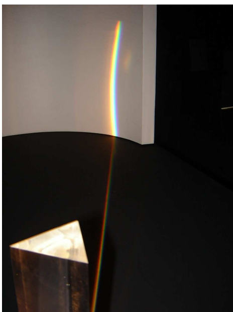
Figura 4 - Experimento “Formando o arco-íris”.

Pesquisadora: O que lhe faz lembrar essa fotografia?