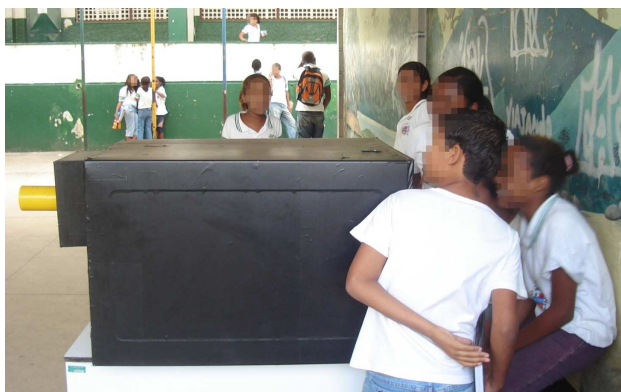
Figura 6 - Fotografia do experimento “Máquina fotográfica”.

Pesquisadora : O que lhe faz lembrar essa fotografia?