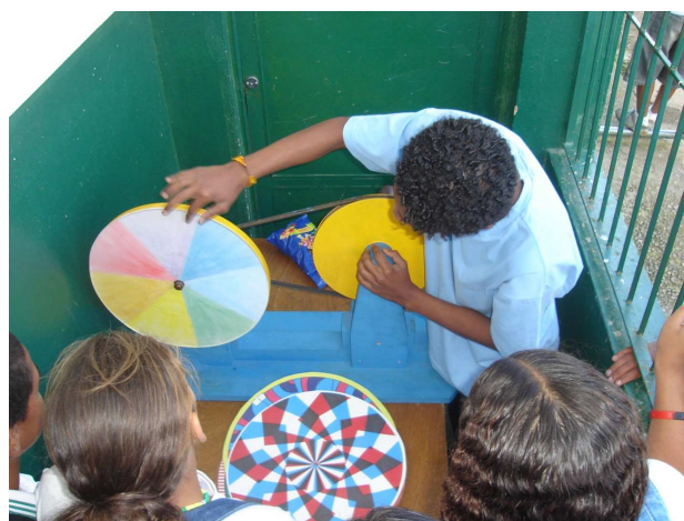
Figura 5 - Experimento “Disco de Newton”.

Pesquisadora: O que lhe faz lembrar essa fotografia?