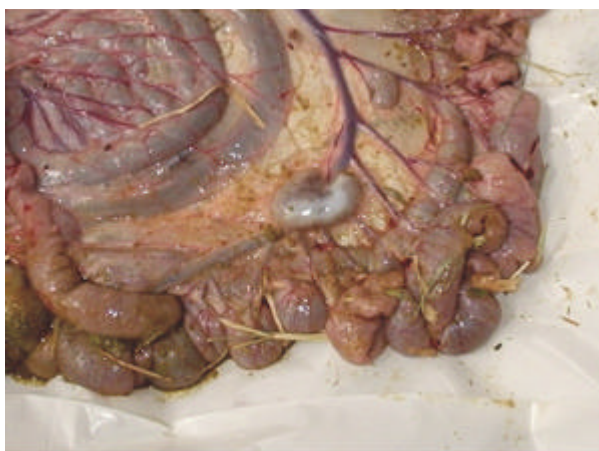
Fig. 3 - Aumento do linfonodo mesentérico.