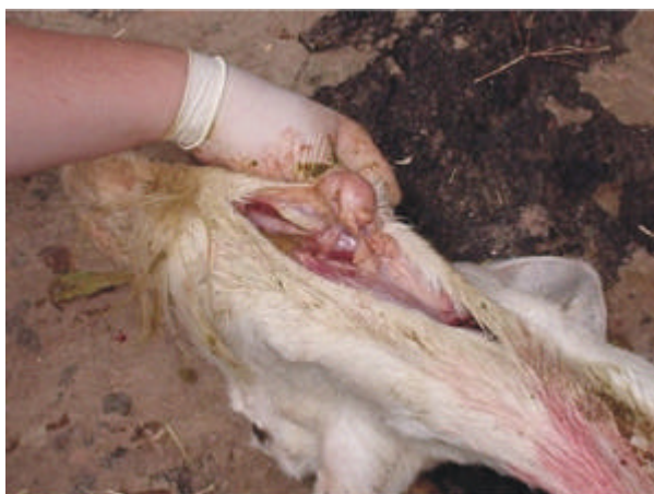
Fig. 1 - Aumento de volume em linfonodo submandibular de caprino acometido de tuberculose.

de idade, com histórico de emagrecimento progressivo e tosse crônica não responsiva à antibioticoterapia convencional. O animal apresentava perda de peso, aumento de linfonodo submandibular esquerdo (Fig. 1) e sintomas de broncopneumonia. Tendo sido considerado positivo no teste cervical comparativo, segundo padrão sugerido para os bovinos (BRASIL, 2004), foi sacrificado e à necropsia foram observadas lesões sugestivas de tuberculose no pulmão (Fig. 2), baço e nos linfonodos submandibulares e mesentéricos (Fig. 3) que, ao corte, apresentavam “ranger de faca”. Nos exames laboratoriais houve, aos 32 dias, crescimento de bacilos álcool-ácido resistentes (BAAR) no meio de cultura de Stonebrink (BRASIL, 1979); o isolado foi identificado como M. bovis na técnica de PCR. Na histopatologia as lesões examinadas apresentavam características dos granulomas típicos (Fig. 4). Usando-se coloração para BAAR foi possível observação de bacilos no centro de um granuloma, sugestivo de Mycobacterium spp. A pesquisa de Corynebacterium sp. foi negativa.