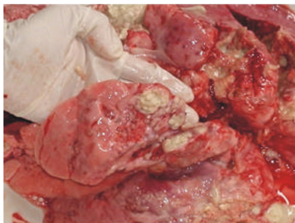
Fig. 2 - Presença de nódulos de necrose de caseificação no parênquima pulmonar de caprino.