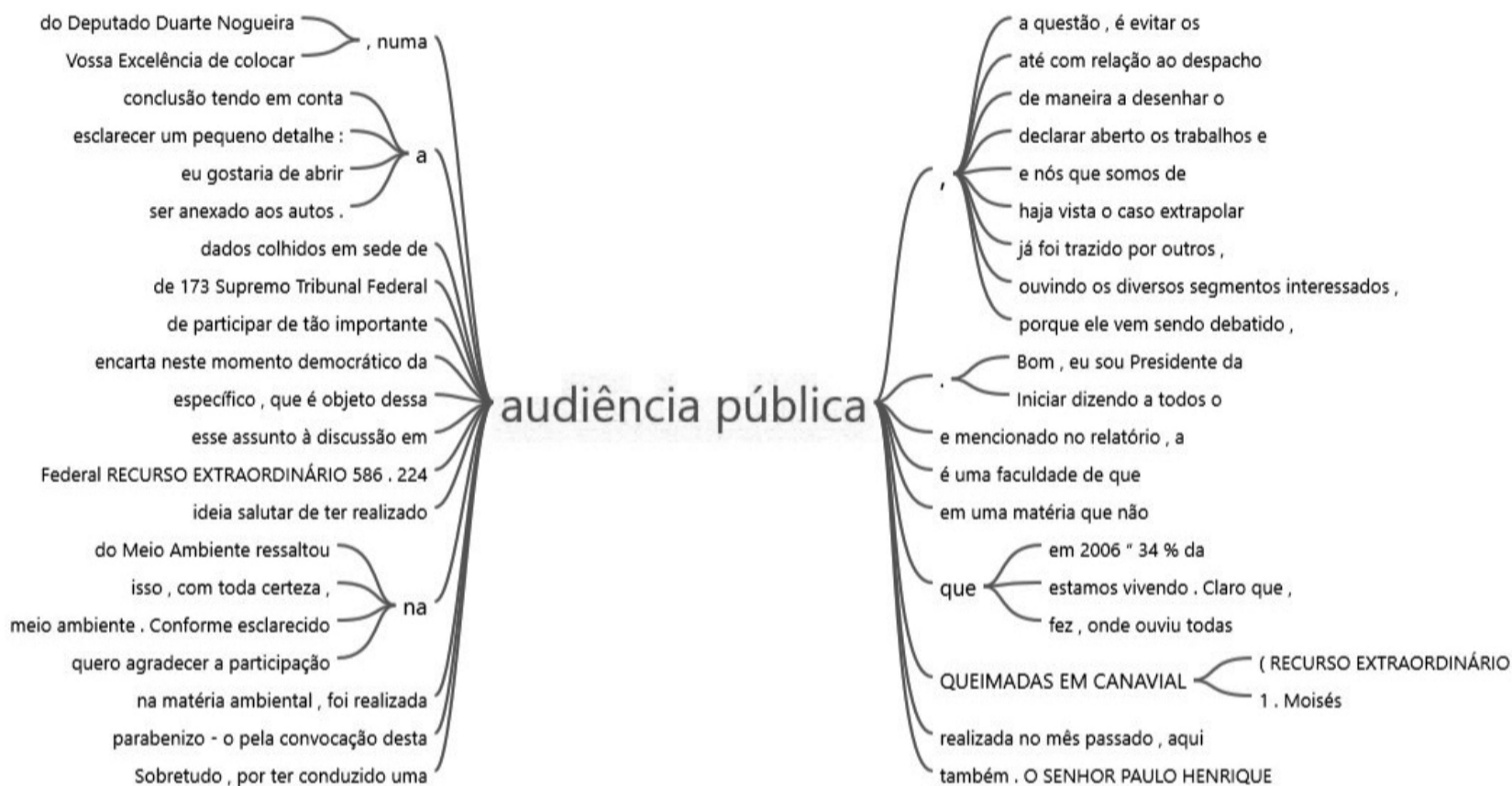
FIGURA 2 – GRÁFICO DE RAIZ COM AS EXPRESSÕES DE MAIOR INCIDÊNCIA RELACIONADAS AO TERMO “AUDIÊNCIA PÚBLICA”