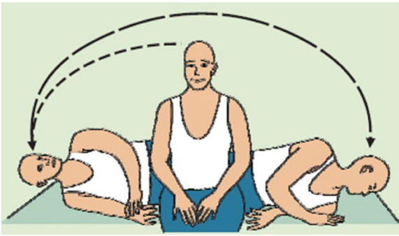
Figura 2 Manobra liberatória de Semont em direção à esquerda para tratamento da cupulolitíase do canal posterior direito. 26

paciente é deitado na posição supina, depois faz um giro com a cabeça virada 45 graus para o lado afetado. O paciente é então levado a uma série de etapas de 90 graus em direção ao lado não afetado, permanece em cada posição de 10 a 30 segundos, completa um giro de 360° e retorna à posição supina em preparação para um rápido e simultâneo movimento com a face para cima para a posição sentada (fig. 3).