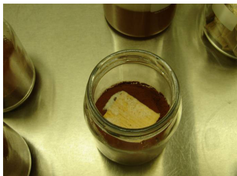
FIGURA 1: Placa suporte após inoculação do micélio do fungo (Fonte: LPF, 2010).

Cada frasco foi inoculado com 1 mL de meio de cultura, contendo o micélio fragmentado, depositado diretamente sobre a placa suporte, conforme a Figura 1. Após a inoculação, os frascos permaneceram na incubadora por duas semanas, para o crescimento do micélio sobre a placa suporte.