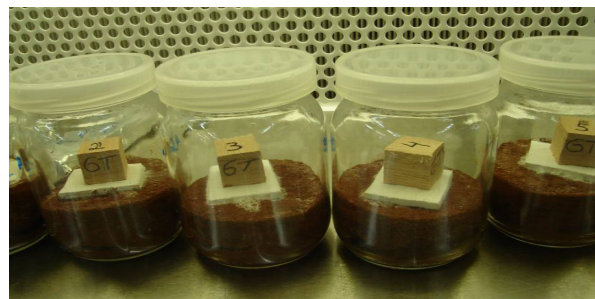
FIGURA 2: Corpos de prova recém-introduzidos nos frascos sobre a placa suporte.

de frascos preparados e inoculados foi 30% superior à quantidade prevista para ser usada no ensaio. Assim, apenas os frascos que visualmente apresentavam o melhor crescimento do micélio e estavam livres de contaminações, foram selecionados para receberem os corpos de prova. Após a colonização das placas de suporte, introduziu-se um corpo de prova em cada frasco de ensaio (Figura 2), os quais permaneceram na incubadora e em contato com os fungos por 12 semanas.