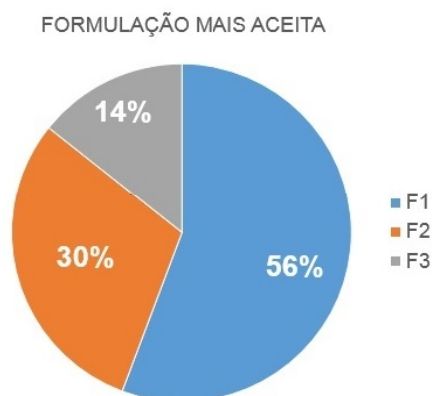
Figura 2. Ordem de preferência segundo os provadores para os cookies elaborados com a farinha do caroço de abacate. (F1) formulação do biscoito com acréscimo de 5% da farinha do caroço de abacate; (F2) formulação do biscoito com acréscimo de 10% da farinha do caroço de abacate; (F3) formulação do biscoito com acréscimo de 20% da farinha do caroço de abacate.

Na Figura 2, estão expressos os valores em percentuais, segundo o teste de ordem de preferência. Verificou-se que a formulação com adição de 5% da farinha do caroço de abacate (F1) foi a mais bem aceita entre os provadores, resultando em 58% de aprovação, seguida da formulação com adição de 10% da farinha do caroço de abacate (F2), que obteve 30% da preferência do público em questão.