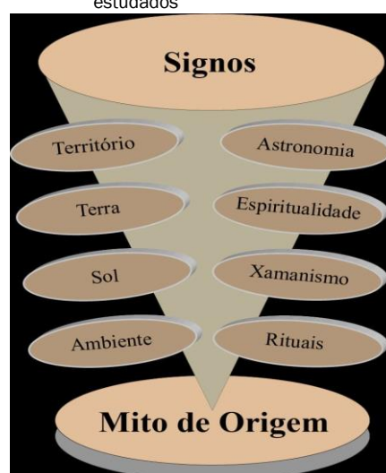
Figura 6 – Signos presente no cotidiano dos povos estudados