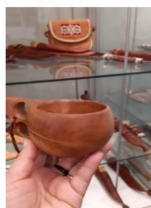
Figura 5 – Utensílio Sâmi