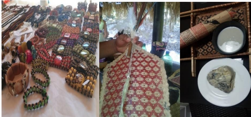
Figura 3 – Mosaico dos signos Sateré-Mawé utilizados no turismo étnico indígena

Da mesma forma, o povo Sâmi que vive do pastoreio atrai visitantes de várias partes do mundo, tendo o elemento sígnico da rena como representante, numa relação harmônica, conforme destacou (Alves, 2011). Nessa direção, também o povo Sateré-Mawé carrega um dos seus maiores símbolos, a formiga tucandeira, usada num ritual de passagem masculino, no qual o neófito passa ao status de guerreiro, tornando-se, de acordo com as tradições do povo, um verdadeiro Sateré. Outra contribuição é a sinalização do turismo étnico em áreas metropolitanas, para um turismo sustentável no contexto social, ambiental e cultural com a finalidade de permanência da tradição, conforme mosaico de signos identitários da cultura Sateré-Mawé, figura 3. Esses signos identitários expressam os artesanatos, a luva da Tucandeira, utensílios e as bebidas tarubá 3 e guaraná ( waraná ) 4 para a ritualística.