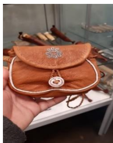
Figura 4 – Artesanato Sâmi

Posto isso, sugerimos diálogos com o Instituto do Patrimônio Histórico e Artístico Nacional (IPHAN, 2000) para assegurar “as formas de expressão; os modos de criar, fazer e viver; as criações científicas, artísticas e tecnológicas; as obras, objeto (...) paisagístico, artístico, arqueológico, paleontológico, ecológico e científico” (IPHAN, 2018, p. 20), como saberes científicos que devem ser zelados na garantia dos registros e ofícios do saber fazer. Observamos que, em contexto híbrido, é quase impossível a não convivência com outras culturas, mas a essência étnica deve ser preservada. Por isso, concordamos com a portaria n.º 375, de 19 de setembro de 2018, capítulo I, artigo 2º, VIII, que trata do Princípio sobre o Desenvolvimento Sustentável. Nessa, está deliberado que: “a geração atual deve ser capaz de suprir suas necessidades, sem comprometer a capacidade de atender as necessidades das futuras gerações” (IPHAN, 2018).