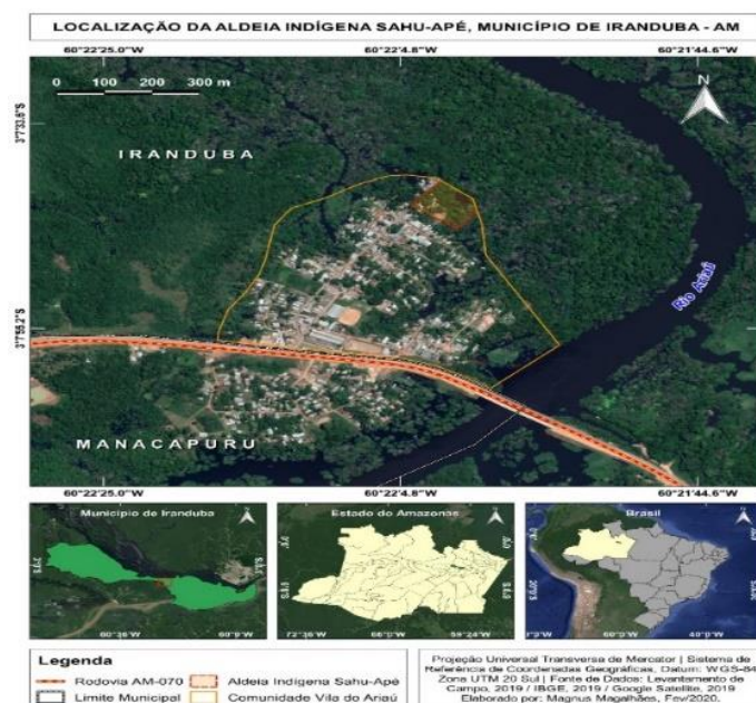
Figura 2 – Localização da área de estudo do povo Sateré-Mawé

Fonte: Elaborado por Magnus Magalhães (2020).