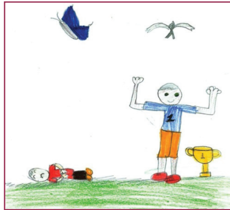
Figura 6 - Desenho de Bob esponja (dez anos)

o outro. Meninos gostam de saber quem é mais forte... Idiotas!”. Sobre o desenho, comentou sorridente: “Aqui o menino matou o colega de brincadeira e ficou com o troféu...”. Realizando o mesmo gesto com os braços, que foi retratado no desenho, finalizou: “Não sou esperta? Minha imaginação é ótima” (DIÁRIO DE CAMPO, 07/11/2017).