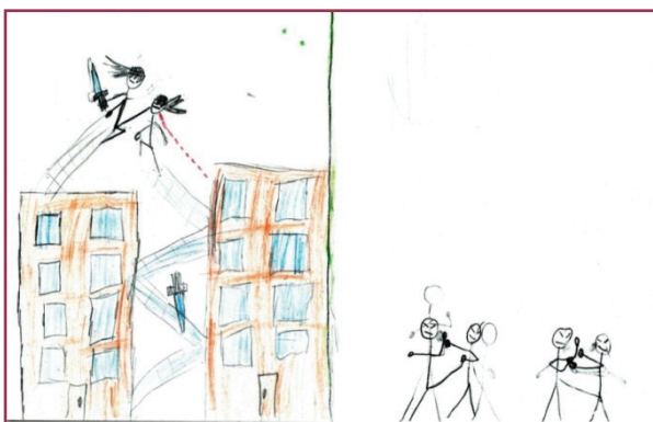
Figura 5 - Desenho de Fábio (nove anos)

Ao abordar seu desenho, Fábio (nove anos) relatou: “Nesse aqui [na direita] eles tão brincando... O outro [esquerda] são dois ninjas brigando, pra ficar no comando da cidade... um é do mal e outro é do bem, vi em um desenho...”. Pedimos que nos falasse mais sobre a produção, assim, continuou: “Nesse aqui tem quatro meninos brincando de lutinha na rua. É que esse aqui é um ninja da água, esse da terra, esse do fogo e esse do vento... Eles se encontraram e começaram a duelar pra ver quem ia ficar no comando”. Esclarecendo a diferença entre as cenas retratadas: “Um é real e o outro é tipo da imaginação. Na briga de verdade um quer dominar a cidade, na de mentirinha eles acharam uma caverna e começaram a brigar de brincadeira...” (DIÁRIO DE CAMPO, 07/11/2017).