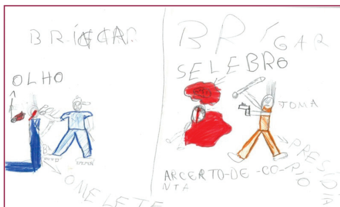
Figura 7- Desenho de Muralha (dez anos)