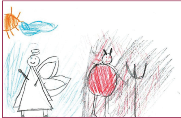
Figura 1. Desenho de Estefany (nove anos)