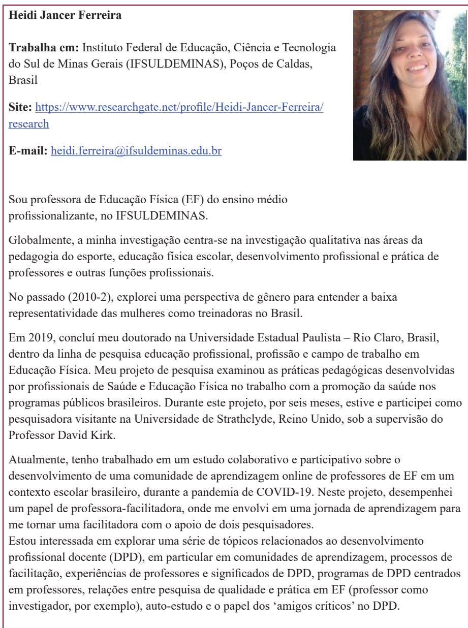
Figura 1 – Exemplo de uma das biografias