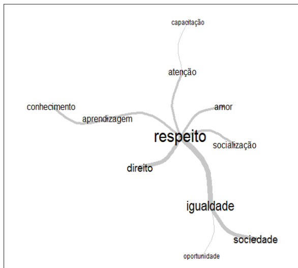
Figura 1. Análise de Similitude entre as palavras evocadas

Quando duas palavras estão interligadas por linhas mais grossas, a interpretação indica que alto número de co-ocorrências desses termos ao longo do corpus . Quanto mais espessas forem essas linhas, maior o número de vezes que as palavras aparecem.