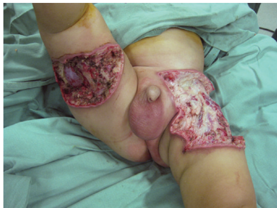
Figura 3 – Aspecto final após desbridamento cirúrgico. Foram necessários mais 2 procedimentos de desbridamento para propiciar leito receptor adequado para cobertura cutânea.