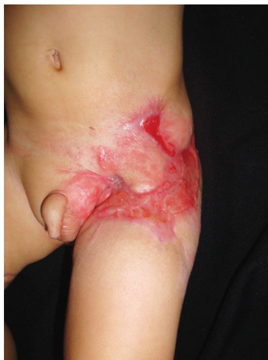
Figura 4 – Aspecto 3 meses após enxertia de pele parcial e uso de retalho de Limberg para proteção dos vasos femorais.