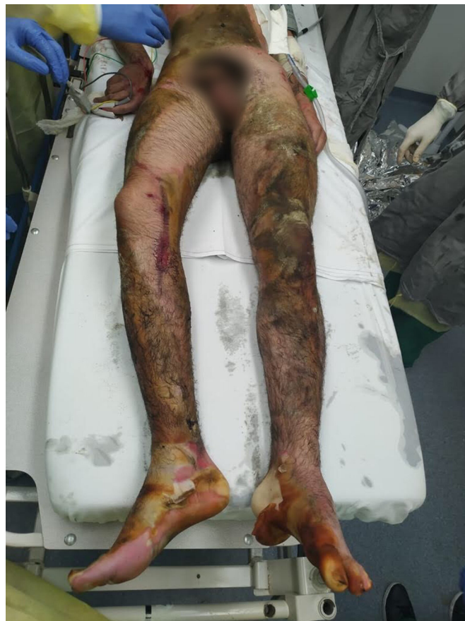
Figura 1. Atendimento inicial de paciente com 50% SCQ predominantemente de 3º grau por chama direta.

Após retirada de DVE e PIC com melhora do quadro clínico, realizada amputação transtibial aberta no 13º dia de internação (DIH). Após 6 dias, o coto apresentava-se isquêmico com presença de necroses (Figura 3), necessitando de ampliação do nível de amputação para transfemorais.