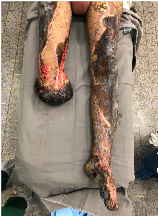
Figura 3. Aspecto necrótico de retalho muscular de coto de amputação transtibial aberta de perna direita e visualização de queimadura extensa e profunda em membro inferior esquerdo.