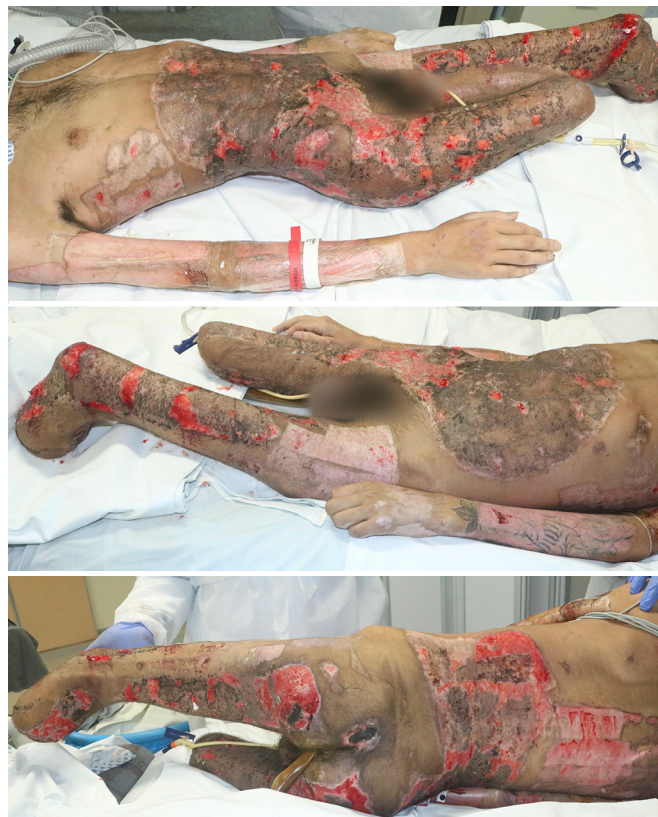
Figura 4. Todas as escaras foram excisadas e cobertas com enxerto parcial de pele em malha 3:1. Os membros superiores foram utilizados 2 vezes como área doadora de pele após 15 dias de restauração. Ainda há áreas ulceradas que serão cobertas por enxerto de pele.