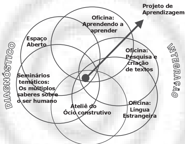
Figura 3 - Programa de Aprendizagem I

Percebe-se na figura a existência de seis atividades interligadas, as quais possuem objetivos complementares e serão descritas a seguir.