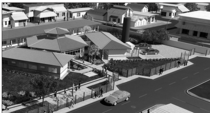
Figura 2 – Projeto de Escola-Padrão do FNDE com Seis Salas de Aula