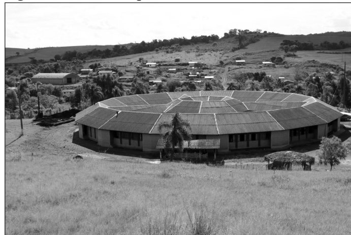
Figura 6 – EIEB Cacique Vanhkre, em Formato Circular