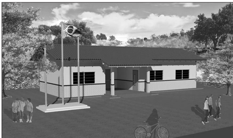
Figura 1 – Projeto de Escola com uma Sala de Aula Padrão FNDE com Indicação para Escolas Indígenas e Quilombolas