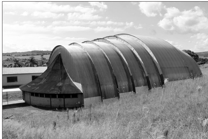
Figura 5 – Ginásio de Esportes da EIEB Cacique Vanhkre, em Forma de Tatu

que contém as salas de aula, a área administrativa, a biblioteca, os refeitórios e os sanitários, com desenho circular, remete às formas de organização de aldeias do tronco linguístico Jê, em que a casa dos homens fica localizada no centro (Novaes, 1983). Segundo o memorial descritivo do projeto, essa edificação expressa aspectos míticos e filosóficos da cultura Kaingang. A construção inicial proporcionava o uso do fogo de chão junto às salas de aula, e o pátio interno era em chão batido, assim como a sala de artesanato. Zanin e Dill (2016) constataram que, posteriormente, algumas dessas características foram alteradas em reformas de manutenção, e o desgaste dos materiais impediu o uso de alguns espaços, como o Centro Cultural.