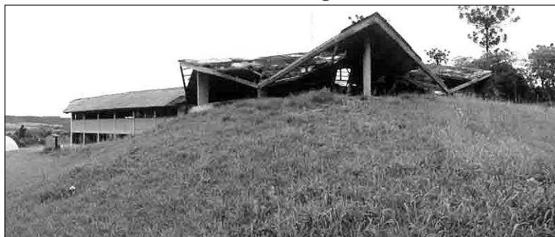
Figura 7 – Centro Cultural da EIEB Cacique Vanhkre, em Forma de Tartaruga