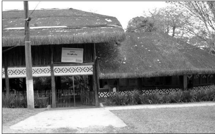
Figura 4 – CECI da Aldeia Krukutu