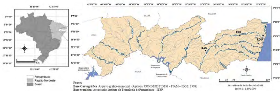
Figura 1 – Localização geográfica dos reservatórios hídricos estudados. RDU – Reservatório Duas Unas; RJU – Reservatório Jucazinho; RAV - Reservatório Arcoverde.

Figura 1 – Geographical location of water reservoirs studied. RDU – Two Reservoir Unas; RJU - Reservoir Jucazinho; RAV – Arcoverde Reservoir.