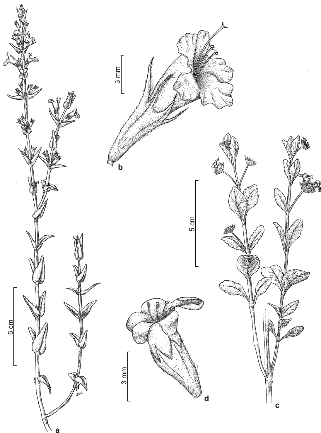
Figura 3 – a-b. Hoehnea scutellarioides (O.S. Ribas et al. 4512) – a. hábito; b. flor, vista lateral. c-d. Hyptis monticola (C.N. Matozinhos et al. 229) – c. ramo com inflorescência; d. flor vista lateral.

Figure 3 – a-b. Hoehnea scutellarioides (O.S. Ribas et al. 4512) – a. habit; b. flower, lateral view. c-d. Hyptis monticola (C.N. Matozinhos et al. 229) – c. branch with infloresce; d. flower, lateral view.