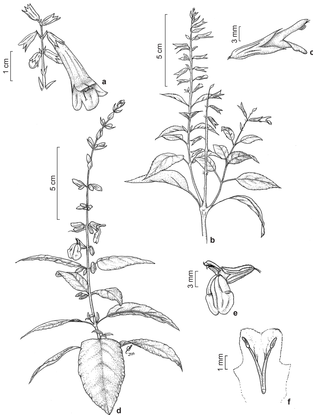
Figura 4 – a. Rhabdocaulon coccineum (C.N. Matozinhos & N.L. Abreu 427) – a. flor. b-c. Salvia arenaria (R.F.N. Camargo et al. s/n) – b. ramo com inflorescência; c. flor, vista lateral. d-f. Salvia viscida (F.R.G. Salimena et al. 3558) – d. ramo com inflorescência; e. flor, vista lateral; f. vista interior da corola, estames. Figure 4 – a. Rhabdocaulon coccineum (C.N. Matozinhos & N.L. Abreu 427) – a. flower. b-c. Salvia arenaria (R.F.N. Camargo et al. s/n) – b. branch with inflorescence; c. flower, lateral view. d-f. Salvia viscida (F.R.G. Salimena et al. 3558) – d. branch with inflorescence; e. flower, lateral view; f. Inner view of the corolla, stamens.