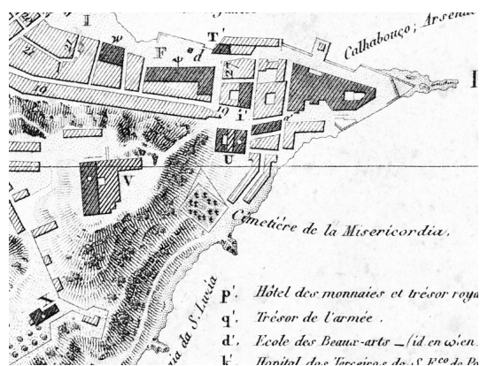
Figura 4 – Detalhe do Plan de la ville de S. Sebastião de Rio de Janeiro produzido pelo explorador francês Louis de Freycinet (1820) .

Figure 4 – Detail of Plan de la ville de S. Sebastião de Rio de Janeiro produced by the french explorer Louis de Freycinet (1820).