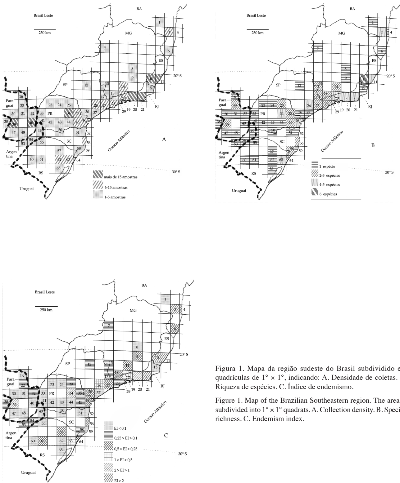
Figura 1. Mapa da região sudeste do Brasil subdividido em quadrículas de 1° x 1°, indicando: A. Densidade de coletas. B. Riqueza de espécies. C. Índice de endemismo.