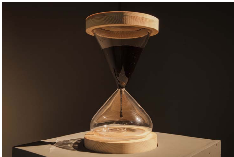
Imagem 2 – Tempo Fóssil (Ampulheta de Betume) . Fonte: Trabalho realizado pela autora em colaboração com Pedro Urano. Escultura (madeira, vidro e betume), 22 x 40 cm, 2016. Essa obra foi realizada durante o período de estágio doutoral na Konstfack University of Arts, Crafts and Design, em Estocolmo, Suécia, com o apoio da bolsa Capes PDSE. Agradecimentos especiais aos professores e técnicos dos laboratórios de metal e vidro da universidade Konstfack.

63 Perfurações e Tempo Fóssil são trabalhos, realizados ao longo da pesquisa, que se encontram na dificuldade de aproximar as escalas do humano e da natureza – um ponto delicado na análise dos impactos ecológicos da humanidade. Mapear e medir são alguns dos métodos utilizados historicamente pelas ciências para relacionar as dimensões do corpo e da Terra. A partir do ponto de vista das artes, o próprio corpo, afinal, é a primeira medida humana de relação com o mundo – o palmo, o pé – e é a partir do corpo que se projeta o reconhecimento do espaço externo. A percepção das dimensões e das escalas estão diretamente relacionadas com a forma com que empregamos nossos sentidos. Um exemplo disso é que, se vendarmos os olhos e bloquearmos a hegemonia da visão, torna-se necessário aguçar outros sentidos para examinar os objetos e o entorno. Invariavelmente, o corpo assume protagonismo como referência primeira, pois, de olhos fechados, é a partir dele que dimensionamos o volume, o peso, a textura, a temperatura. Observar passa a ser, portanto, um exercício de corpo – o observador cego tateia, emprega seu corpo no movimento de examinar outro corpo.