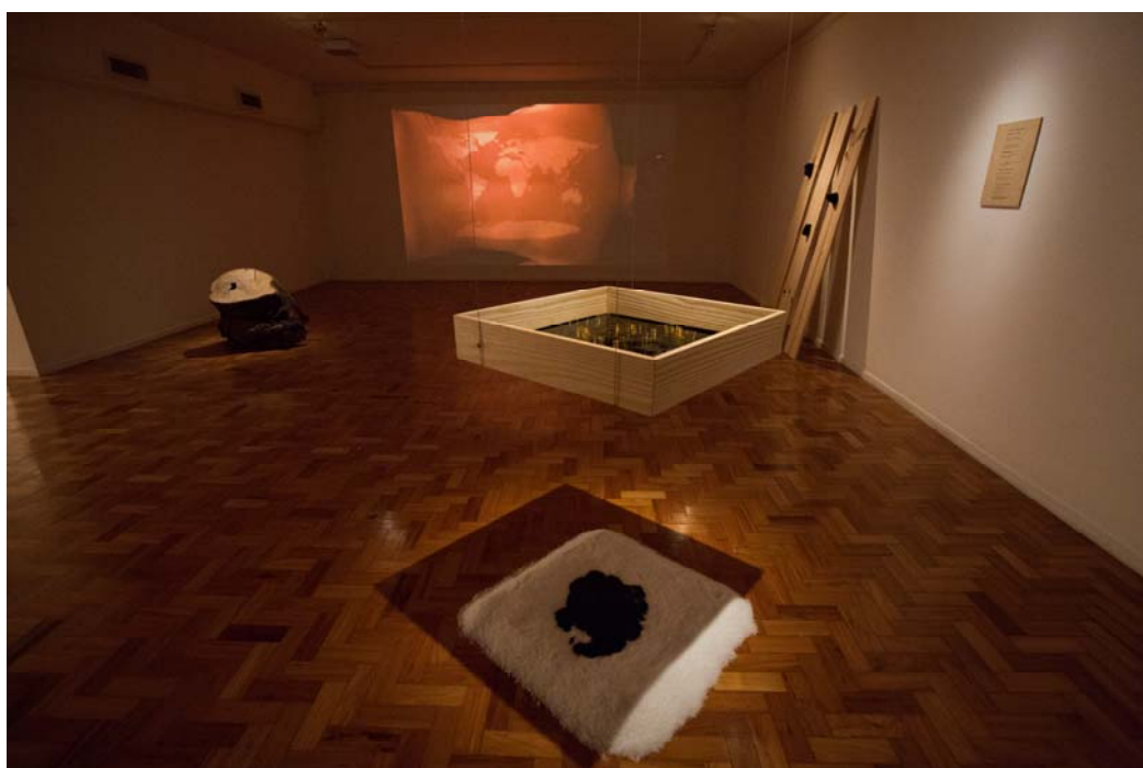
Imagem 1 – Fotografias de 63 Perfurações e sua montagem na exposição Tempo Fóssil , realizada na Galeria Ibeu, Rio de Janeiro, em 2016.

Fonte: Performance orientada para vídeo, realizada pela autora. 25 min., 2015.