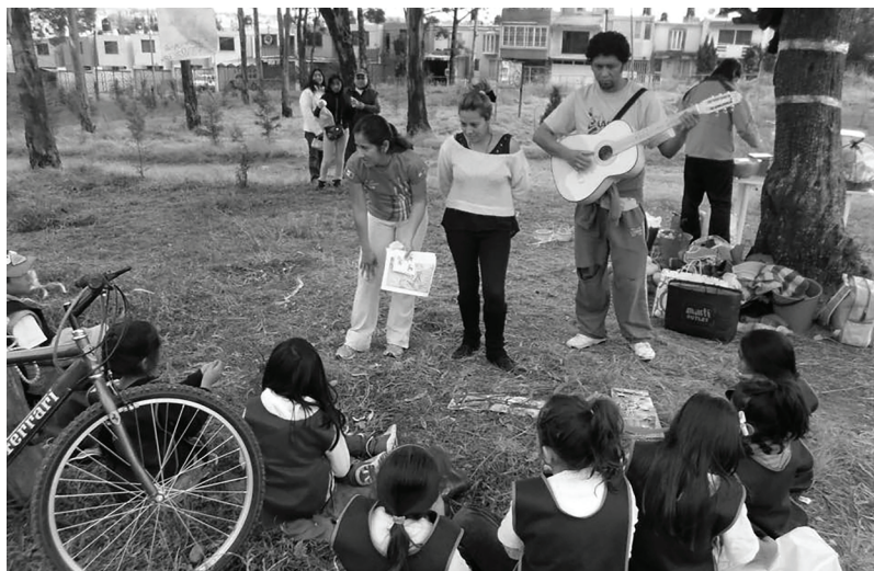
Figura 5: Trabajo con niños durante las campañas de reforestación del Grupo REAFCA.