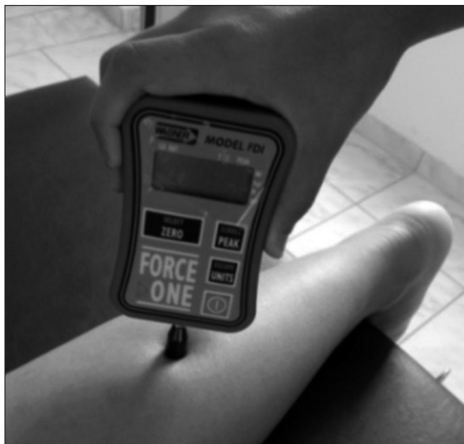
Figura 1. Leitura de algometria de pressão no acuponto B57 (Chengshan), no ventre do músculo gastrocnêmio

cia com as agulhas foi de 20 minutos para todos os grupos. Para o Gsham , foi escolhido um local distante medialmente 2 cm do ponto E36. O GCRT não recebeu nenhuma forma de intervenção, permanecendo em repouso na maca pelo mesmo tempo dos demais. As voluntárias não souberam se estavam recebendo a ACP verdadeira ou sham . A orientação do exercício e as avaliações do número máximo de repetições em um minuto em todos os momentos foram realizadas por uma professora de Educação Física convidada, que não sabia qual o grupo que foi designado cada voluntário, sendo o estudo encoberto por parte do avaliador.