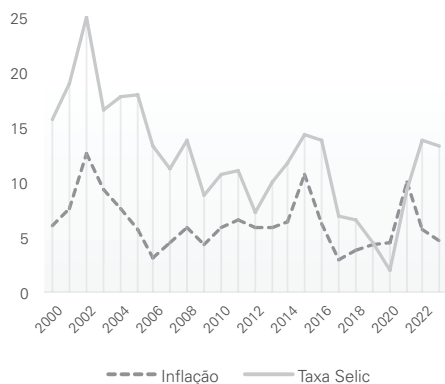
Figura 2: Taxas de inflação e taxa de juros Selic no Brasil