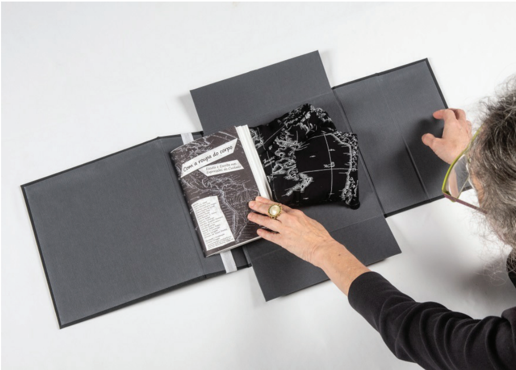
Figura 11. Dentro do livro em formato de caixa estão o vestido e uma cópia única em papel do livro com textos produzidos durante as Oficinas.