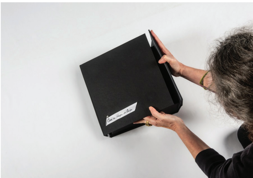
Figura 10. Com a Roupa do Corpo é o título do livro objeto e também do e-book produzido pelos alunos.