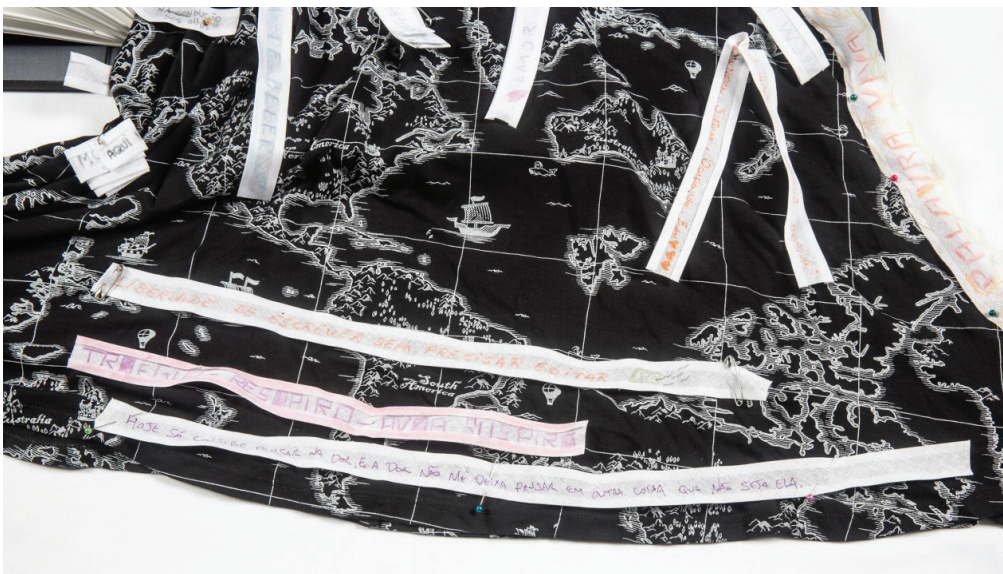
Figura 7. Frases e palavras escritas fixadas no vestido, incorporando novos sentidos à experiência.

Um vestido com estampa de antigos mapas náuticos, adquirido em uma feirinha de rua, usado como uniforme da pesquisadora em todos os encontros, foi peça-chave deste trabalho realizado em cidade portuária. No último dia das oficinas, a pesquisadora despiu-se dessa “pele” do trabalho. Essa peça de roupa, impregnada por toda a experiência, por tantos deslocamentos corporais e de linguagem, foi colocada no centro do círculo, tornando-se o suporte de uma criação coletiva que sintetizou todo o percurso vivido nas oficinas. O convite foi para os participantes escreverem, em fitas de algodão, frases ou palavras que descrevessem a experiência e as fixassem sobre o mapa-vestido com alfinetes.