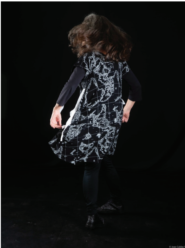
Figura 17. A pesquisa-intervenção incorporada, vestindo o pesquisador também criado no desenrolar do processo de criação.

É passando pelas camadas profundas da anatomia, da criação e das subjetividades que a pesquisa enraizou a pesquisadora em uma proposta de escrita como micropolítica de resistência para trazer calor e recolher as secreções – conteúdos apresentados, textos literários, cadernos de notas, fotografias, áudios, registros de todos os tipos, o diário virtual do pesquisador – capazes de fertilizar novos vínculos e conexões sensíveis individualmente, no grupo, no coletivo, em outros territórios.