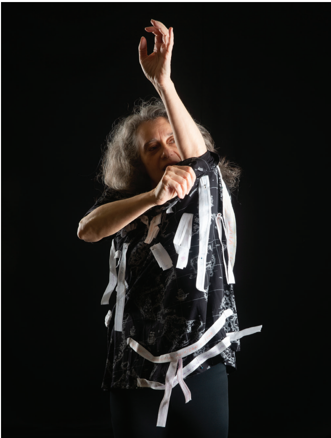
Figura 20. A pesquisa-intervenção incorporada, vestindo o pesquisador também criado no desenrolar do processo de criação.