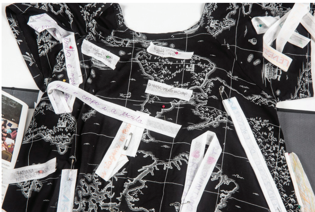
Figura 16. O alfinete vermelho marca no mapa o local de realização da pesquisa. No lugar do coração são fixadas as palavras “o nascimento do corpo”.