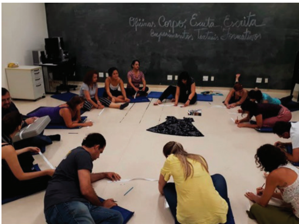
Figura 5. Ao final do processo, que durou um semestre, o mesmo vestido transformou-se em suporte para produção coletiva.