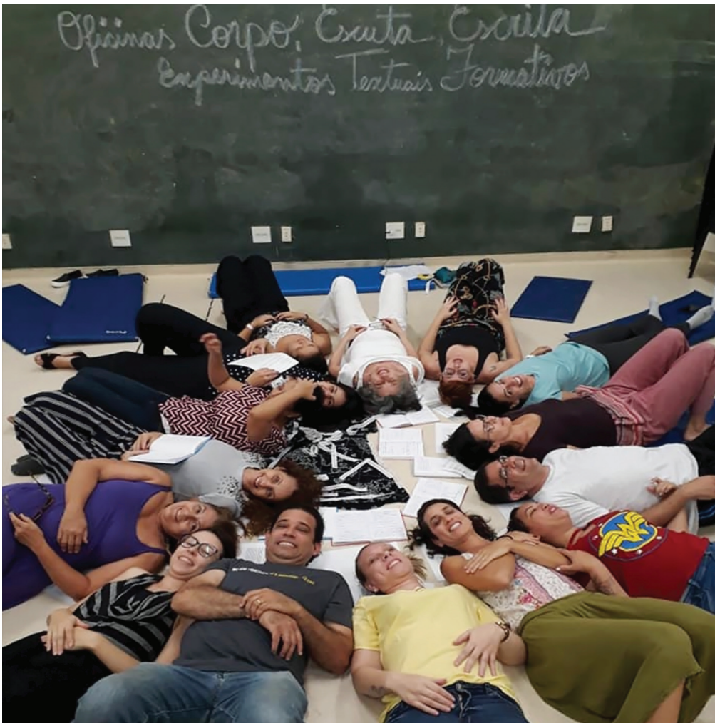
Figura 21. As muitas camadas do processo de criação de corpos, de textos, de vínculos permeados pela pesquisa. Momento final das oficinas, dezembro de 2019.

Imaginamos que dedicar tempo e energia para produzir pesquisas e seus muitos recortes em escrituras – dissertações, teses, prontuários, relatórios, literatura – nessa conturbada contemporaneidade, com todos os micro e macroatravessamentos, micro e macroimpactos sentidos em nossos corpos a cada dia, quando aliados a processos de criação, podem ajudar a organizar e digerir o presente e a renovar a potência criativa, ela mesma.