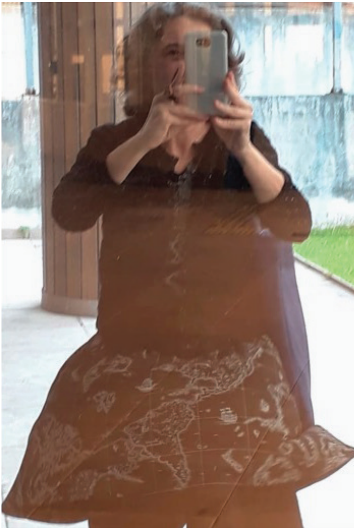
Figura 4. O vestido com mapas náuticos foi usado pela pesquisadora em todas as aulas, como um uniforme.

“Dar passagem, fazer passagem, ser passagem” 11 (p. 75) parece ser o caminho mais sintonizado com o propósito de manter a vida da pesquisa, a vida do pesquisador, a vida do campo pesquisado, a vida de todos os vivos envolvidos em aprimorar a presença em todos os ambientes, incluindo o profissional.