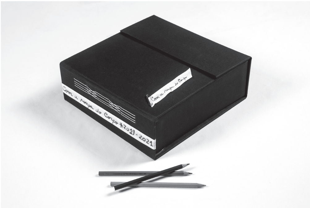
Figura 9. O livro-objeto, peça única, em formato de caixa, guarda o vestido obra coletiva, território da experiência vivida pelo grupo.