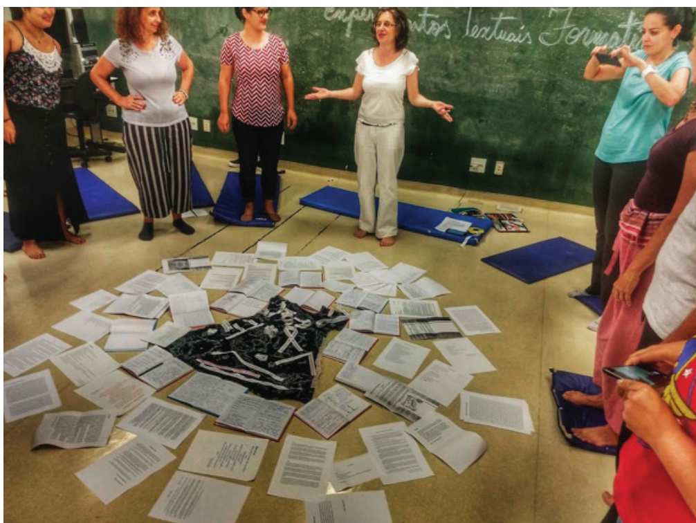
Figura 6. Palavras que sintetizaram o vivido foram anexadas ao vestido, território têxtil de uma produção grupal.