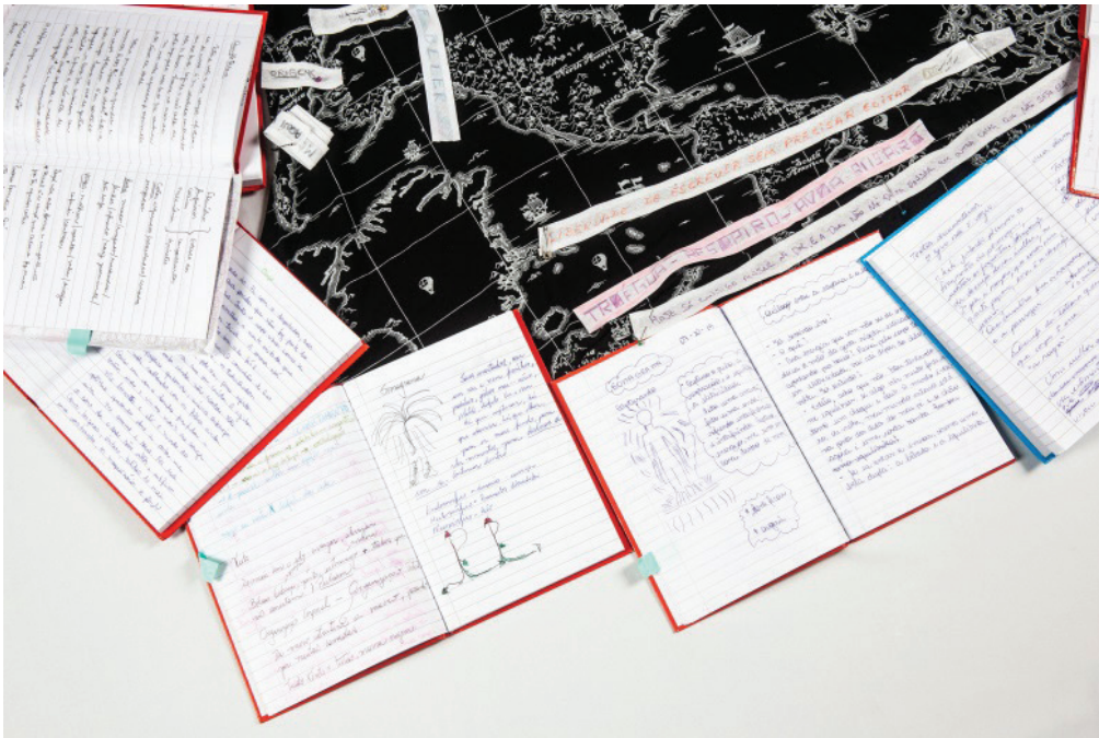
Figura 2. Escrita em letra cursiva, desenhos e outras notas deram espaço para os fluxos de pensamento e suporte para o processo criativo.