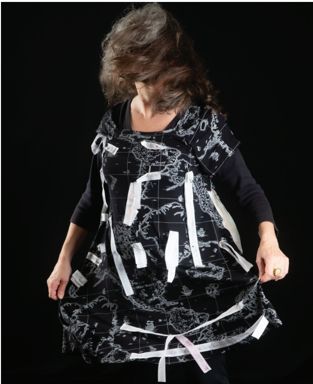
Figura 18. A pesquisa-intervenção incorporada, vestindo o pesquisador também criado no desenrolar do processo de criação.