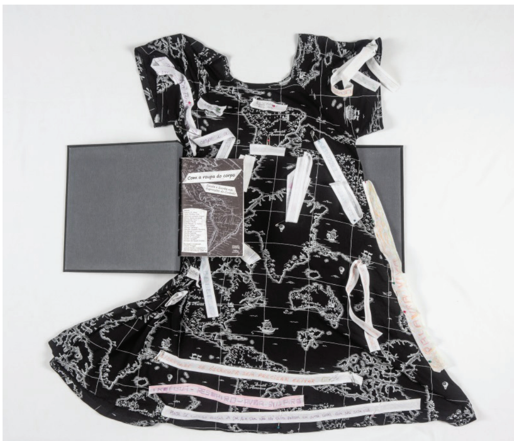
Figura 15. A pesquisa ganhou a forma de obra plástica e literária dando materialidade ao processo, que pode seguir vivo e amplificando a potência do vivido na academia para outros contextos de educação, expressão e cuidado.