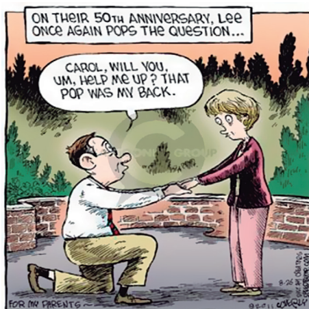
Figura 2 – EI pop the question

tipo episódico (os “modelos cognitivos” socioculturalmente determinados e adquiridos através da experiência).” (KOCH, 2016, p. 32). Inscritos nessa perspectiva pragmática, ou seja, “[...] como lugar de extensões referenciais ou função dos conhecimentos compartilhados ” (ORTÍZ ALVAREZ, 2000, p. 176, grifo da autora), os estudos das EI possuem laços estreitos com o ensino-aprendizagem de línguas, uma vez que o contexto, tanto em LE como em LM, é o fator determinante para que os aprendizes compreendam os sentidos idiomáticos e as funções comunicativas subjacentes (ETTINGER, 2008; NOGUEIRA, 2008; FONSECA, 2017; ROZENFELD, 2019).