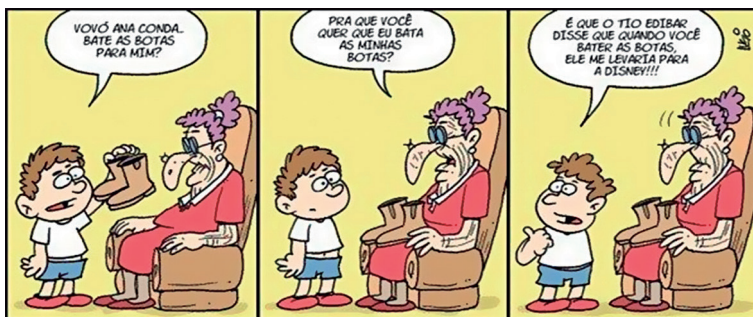
Figura 4 – EI bater as botas

Sobre a Fig. 3, que trata do continuum de “composicionalidade”, destacamos o fato de que as ocorrências de estruturas linguísticas recaem em qualquer ponto à extensão dos extremos, a saber, as sequências literais como em escrever um e-mail e itens não decomponíveis, ou não composicionais. A literatura especializada sobre a abordagem composicional, contudo, prevê a existência, embora muito rara, de EI não decomponíveis (GLUCKSBERG, 1993; TITONE; CONNINE, 1999; GIBBS; COLSTON, 2007; VEGA-MORENO, 2005). Acerca desse aspecto, observemos a Fig. 4.