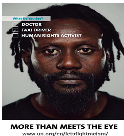
Figura 7 – EI more than meets the eye