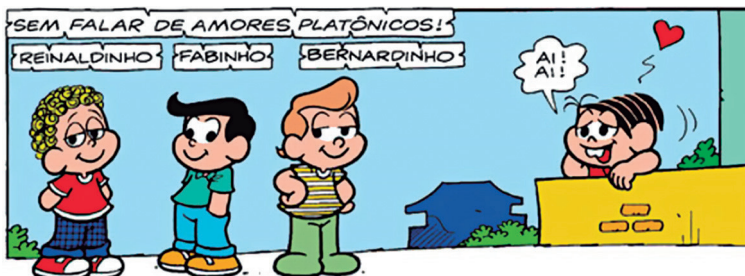
Figura 6 – EI amores platônicos

A fim de que discorramos acerca da maneira como os processos classificatórios contribuem para a compreensão idiomática, analisemos a Fig. 6, retirada do quadrinho da Turma da Mônica , intitulado Coleções e cuja composição acomoda a EI amores platônicos .