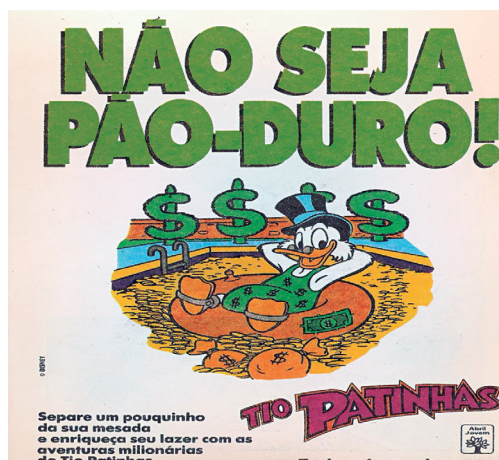
Figura 8 – EI Pão-duro

Reportamo-nos aos processos conceituais simbólicos na Fig. 8, um anúncio publicitário infantil da revista do Tio Patinhas , com base na qual discorremos a respeito da maneira como as categorias da estrutura representacional conceitual simbólica, a saber, o portador e seus atributos, servem de pistas visuais para a compreensão da EI pão-duro , evidenciada em caixa alta no topo da imagem.