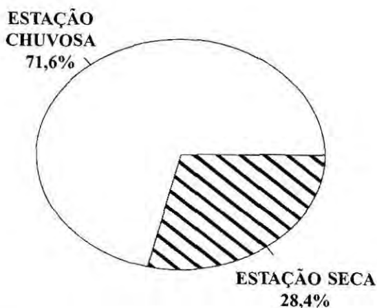
Figura 3. Número percentual de machos de Euglossinae atraídos por iscas-odoríferas nas estações seca e chuvosa, em Barreirinhas, MA, Brasil.