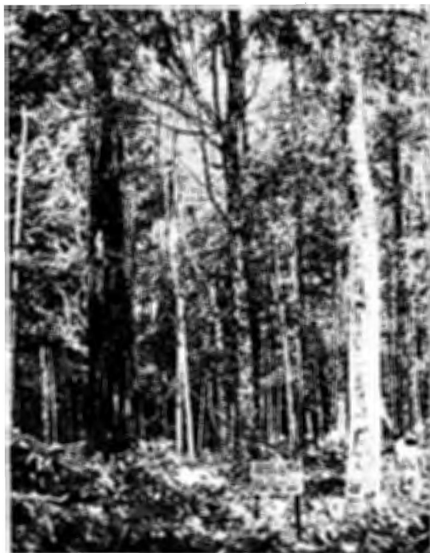
Fig. 8. Goupia glabra apresenta uma forte regeneração natural depois da exploração madeireira sob um sistema que conserva árvores matrizes, como fontes de sementes (Estação Experimental da SUDAM, Curuá-Una, Pará).

plantações perenes, estabelecimento de uma vegetação com características ecológicas desejáveis e uma solução do problema das pressões de migração das áreas rurais às áreas