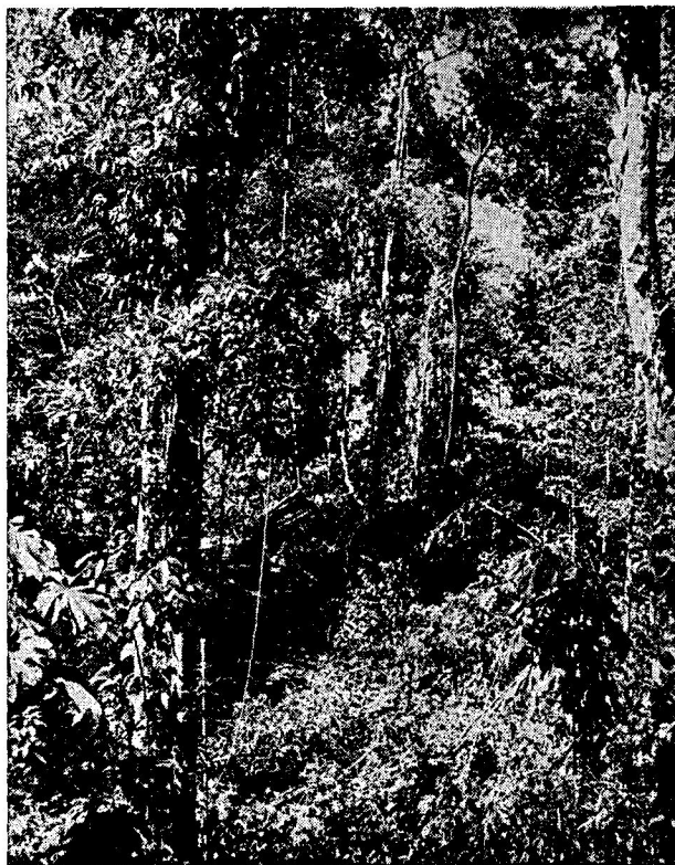
Fig. 6. Floresta tropical de Mora excelsa , após a exploração predatória, oferece poucas condições para regeneração natural da floresta e a possibilidade de futuras safras (Matura, Trinidad, I.O.).

É também importante observar que depois de anos de manejo florestal, via de regra, baseado em sistemas de tratamento silvicultural, tais como o "Malayan Uniform System" ou "liberation thinning", este sistema está sendo suplantado pelo sistema de manejo dando o mínimo de tratamento pós-exploratório em combinação com a exploração não intensiva, por exemplo, em floresta de caráter amazônico em Trinidad e Tobago (Bell, 1971) (Fig. 6 e 7) e em algumas áreas no sudeste da Ásia.