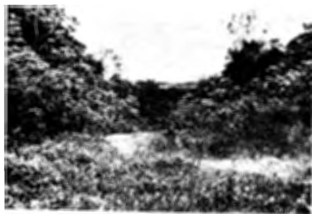
Fig. 9. Depois da exploração predatória muitos terrenos localizados perto de centros urbanos ficam abandonados ou subprodutivos (floresta explorada e roças abandonadas, perto de Manaus, Amazonas).

urbanas. Igualmente importante é que esta estratégia com ênfase em tais áreas, a curto prazo, reduz a pressão para a exploração das florestas ainda intactas para fins agrícolas inapropriados, como cultivos anuais e para exploração madeireira intensiva, enquanto que ainda não existe um programa de manejo florestal suficientemente elaborado para garantir a sustentabilidade de produtos florestais a longo prazo.