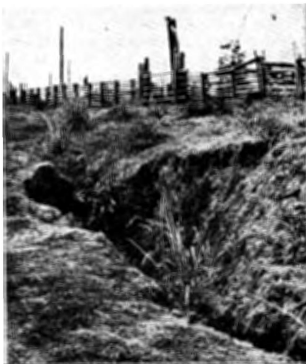
Fig. 1. Pastagens artificiais implantadas na zona da floresta tropical na Amazônia apresentam problemas com a manutenção de produtividades devido a erosão e compactação do solo e lixiviação (fazenda no rio Curuá-Una, Pará).

rendimento do projeto em si mesmo. Muitas vezes, isto tem como resultado final uma área desmatada completamente decapitalizada e não desenvolvida (Fig. 3). Mesmo nos casos menos extremos, a influência dos incentivos