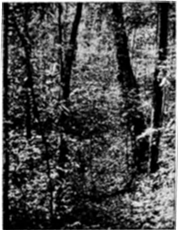
Fig. 7. — A forte regeneração natural de Mora excelsa admite a possibilidade de manter-se uma fonte sustentável de madeira sob um sistema de manejo adequado e não predatório (Victoria-Mayaro Reserve, Trinidad, I.O.).

Este sistema de manejo, baseado em regeneração natural da floresta, está sendo pesquisado desde 1963 num projeto-piloto, na floresta tropical da Amazônia brasileira, com bastante êxito (Fig. 8).