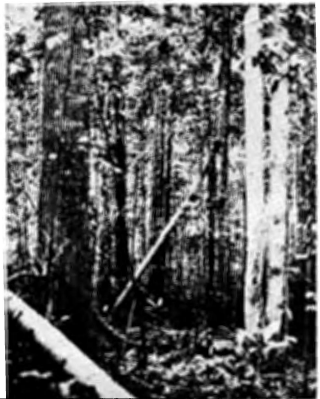
Fig. 5. Exploração controlada e não intensiva, com leve tratamento silvicultural pode diminuir em até 20 anos o prazo entre os cortes de madeira numa floresta, em comparação com florestas de uso intensivo (floresta tropical de Dipterocarpaceae apresentando forte regeneração natural de Shorea curtissii na Malásia).