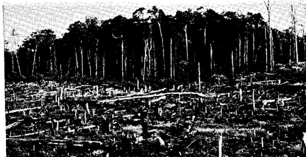
Fig. 3. Incentivos fiscais para o desmatamento de grandes áreas muitas vezes resulta na decapitalização completa da área (fazenda na Estrada Manaus-Caracará, perto de Manaus, Amazonas).

fiscais existentes é no sentido de decapitalização parcial ou completa que ultrapassa a taxa de pesquisas sobre a conservação e utilização de maneira sustentável destes recursos.