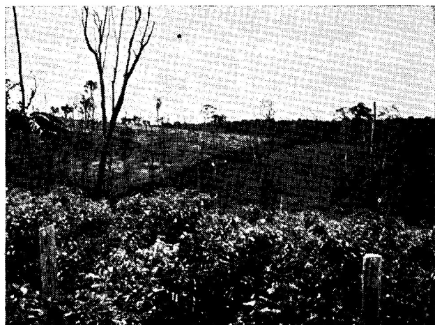
Fig. 2. Pastagens artificiais implantadas na zona da floresta tropical na Amazônia com problemas de invasão de ervas daninhas (fazenda no rio Curuá-Una, Pará).

fiscais existentes é no sentido de decapitalização parcial ou completa que ultrapassa a taxa de pesquisas sobre a conservação e utilização de maneira sustentável destes recursos.