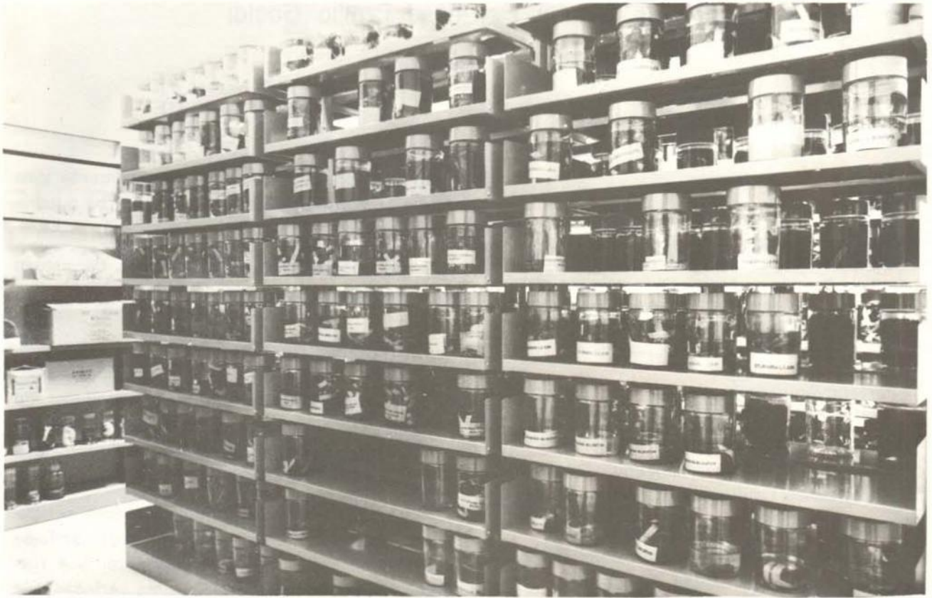
Fig. 1 — Vista geral das coleções em meio líquido de Quirópteros.

sity of Connecticut, USA ( 1975, 1978, 1980); P. Hershkovitz, Field Museum of natural History, Chicago (1979); V. A. Taddei, Universidade Estadual Paulista, São José do Rio Preto-SP (1978).