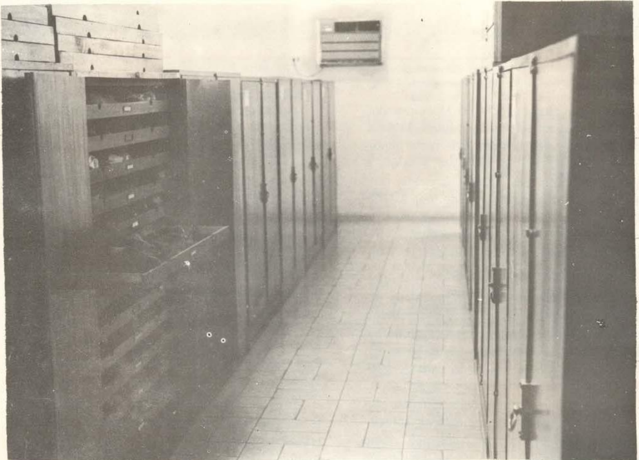
Fig. 2 — Vista parcial das coleções de peles de Mamíferos e Aves.