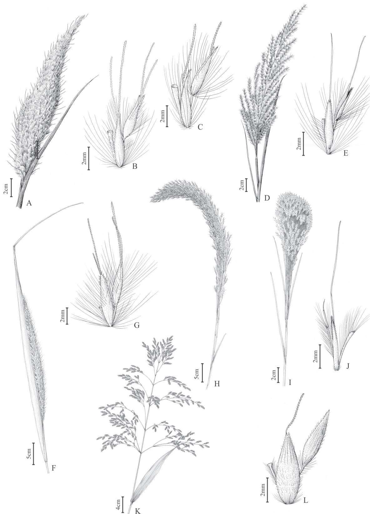
Figura 3. A-C. Saccharum angustifolium . A. Inflorescência, B. diásporo com espiguetas sésseis pilosas e com duas aristas, C. diásporo com espiguetas sésseis glabras e com uma arista (B. Tonic & A. Zanin 278); D-E. S. asperum . D. inflorescência, E. par de espiguetas (B. Tonic & A. Zanin 306); F-G. S. villosum . F. inflorescência, G. par de espiguetas (B. Tonic & A. Zanin 279); H. Schizachirium glaziovii , inflorescência (A. Zanin & Santos 1605); I-J. S. microstachyum . I. inflorescência, J. par de espiguetas (A. Zanin & Santos 1604); K-L. Sorghum halepense . K. Inflorescência, L. par de espiguetas (B. Tonic & A. Zanin 201).