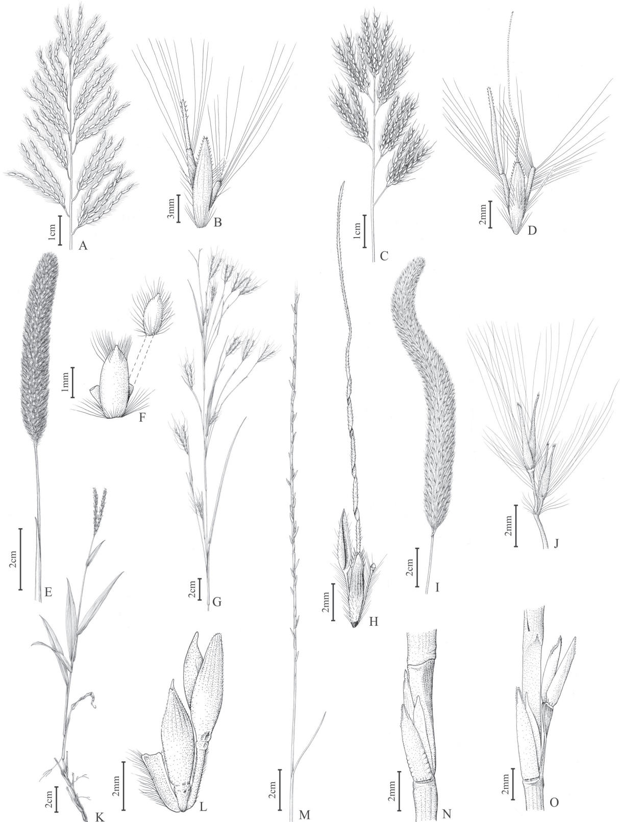
Figura 2. A-B. Bothriochloa exaristata . A. inflorescência, B. par de espiguetas (B. Tonic & A. Zanin 232); C-D. B. laguroides var. laguroides . C. inflorescência, D. par de espiguetas (B. Tonic & A. Zanin 205); E-F. Eriochrysis cayennensis . E. inflorescência, F. par de espiguetas (A. Zanin et al.1594); G-H. Hyparrhenia rufa . G. inflorescência, H. par de espiguetas (B. Tonic & A. Zanin 241); I-J. Imperata brasiliensis . I. inflorescência, J. par de espiguetas (B. Tonic & A. Zanin 286); K-L. Ischaemum minus . K. Inflorescência, L. par de espiguetas (B. Tonic & A. Zanin 284); M-O. Rhytachne rottboellioides . M. Inflorescência, N. par de espiguetas com a pedicelada reduzida, O. par de espiguetas com a pedicelada desenvolvida (B. Tonic & A. S. Mello 269).