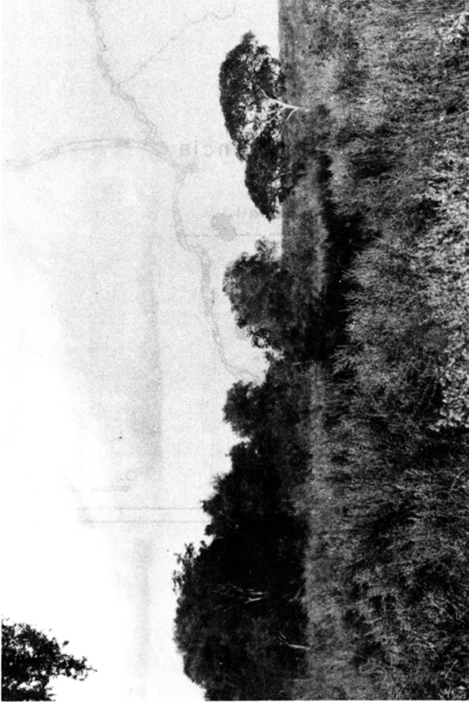
Figura 2: Aspecto del bosque subtropical del escarpe occidental, río Paraná. Nótese el valle de inundación del río ("banados") al fondo. Los dos primeros árboles a la derecha son ejemplares de Enterolobium contortisiliquum . Cerca da Va. Ocampo.