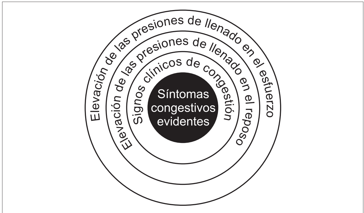
Figura 1 - Potenciales objetivos terapéuticos relacionados con la elevación de las presiones de llenado ventricular en pacientes con insuficiencia cardíaca.

examen físico por diferentes médicos es pequeña. El estándar oro para la evaluación hemodinámica en la IC es el catéter de la arteria pulmonar (Swan-Ganz), y varios estudios compararon la evaluación hemodinámica invasiva con el examen físico, demostrando la limitación de esa evaluación para definir la congestión o el bajo débito.