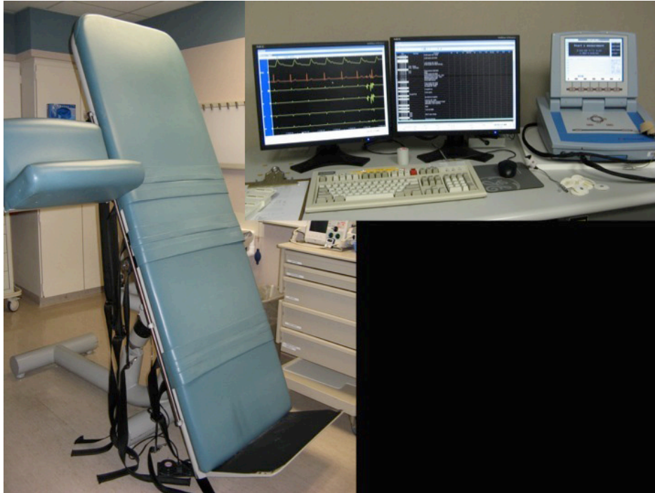
Figura 1 - Mesa inclinada a 70 grados con soporte para los pies y para el miembro superior en que la PA será medida. Las cintas de velcro permiten la contención del paciente en caso de pérdida del tono postural. Los equipamientos necesarios son (de derecha a izquierda): aparato de monitoreo no invasivo de la PA latido a latido y monitores para visualización del ECG y curva de PA.