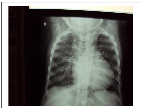
Fig. 2 - Radiografia de tórax mostra cardiomegalia e trama vascular pulmonar aumentada condizente com cardiopatia com desvio de sangue da esquerda para a direita, tipo comunicação interventricular.