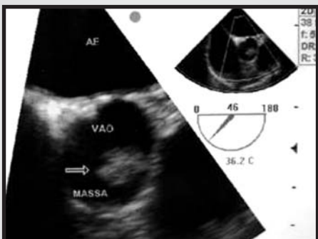
Fig. 2 - Ecocardiograma transesofágico demonstrando a massa tumoral pediculada aderida à valva aórtica.