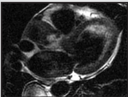
Fig. 3 - Imagem da ressonância nuclear magnética evidenciando a massa tumoral pediculada em folheto da valva aórtica.