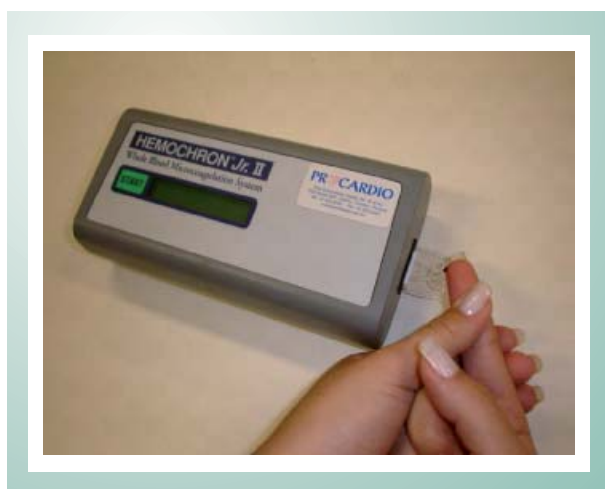
Fig. 1 - Amostra de sangue capilar obtida por punção digital aplicada ao dispositivo portátil Hemochron Jr. II.

A calibração era feita diariamente, como também o ensaio de controles internos comercializados pelo fabricante. Um