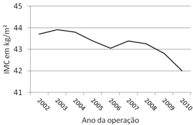
FIGURA 2 - Variação do IMC médio dos pacientes submetidos à cirurgia bariátrica na operadora da saúde suplementar entre 2002 a 2010

A taxa de mortalidade intra-hospitalar foi de 5,5 por mil pacientes operados pelo SUS em todo o Brasil e de 3,0 por mil pacientes na operadora de saúde, com RR bruto igual a 1,84 (IC95% 1,04 a 3,20). Entre os pacientes operados pelo SUS na região sudeste do país, a taxa de mortalidade foi de 4,4 por mil, gerando um RR igual a 1,47 (IC95% 0,79 – 2,72) em comparação à taxa de óbito observada na operadora de saúde (Tabela 2).