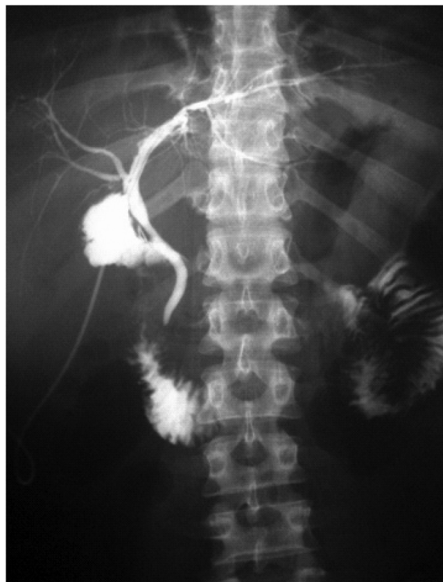
FIGURA 2 - Colangiografia através da sonda das vias biliares: observa-se sonda passando pelo coto, dirigindo-se ao ducto hepático esquerdo, com enchimento de toda árvore biliar e leve extravasamento perifistular, dando origem ao bilioma

A paciente recebeu alta 15 dias após, com sonda funcionante em bom estado geral, sem queixas ou outras complicações. Retornou seis dias após com dor abdominal em epigástrio e sonda não funcionante. Foi realizada ultrassonografia abdominal, evidenciando bilioma em região epigástrica que foi puncionado com um cateter intravascular periférico nº 14, guiado pelo ultrassom. Aspirou-se aproximadamente um litro de bile e foi mantida a sonda da via biliar. Retornou após mais uma semana com leve dor em epigástrio e novo estudo ultrassonográfico visualizou bilioma recidivante. Nova punção foi feita guiada por ultrassom, drenando 400 mL de bile. Foi colocada sonda nasogástrica nº 6 na área do bilioma e realizada colangiografia pela sonda