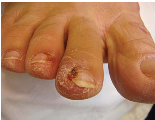
FIGURA 3: Granulomas piogênicos em dobras ungueais de pé após uso de cetuximabe

A siringometaplasia escamosa écrina não parece estar relacionada a um agente quimioterápico especí-