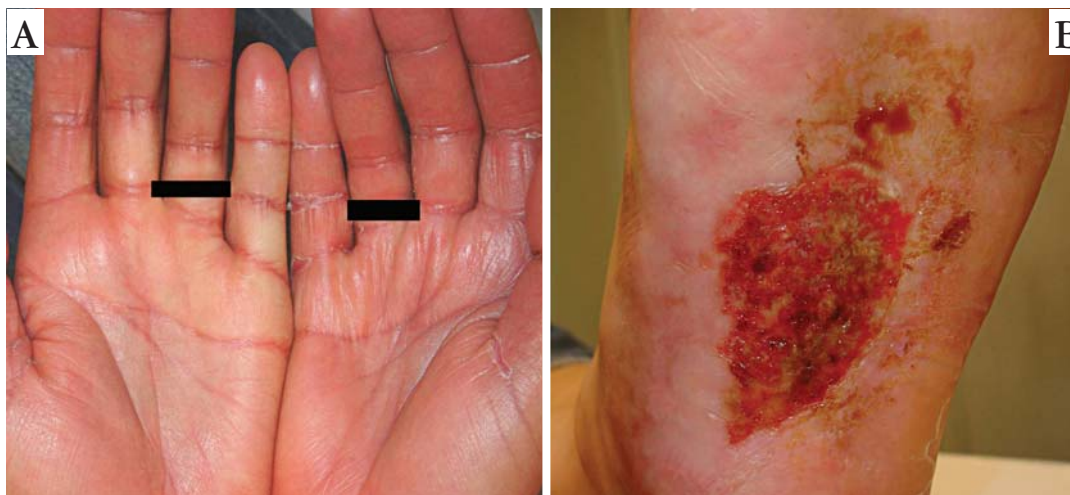
FIGURA 5: Eritema e edema palmar (A) e lesão erodida após ruptura de bolha na região plantar (B), após uso de doxirrubicina