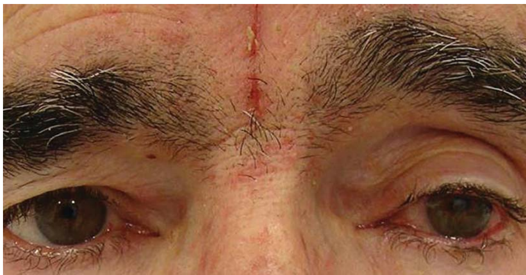
FIGURA 1: Crescimento excessivo e acentuação da curvatura das sobrancelhas e dos cílios em vigência de erlotinibe

A siringometaplasia escamosa écrina constitui uma reação adversa incomum aos quimioterápicos. Pode, também, estar associada com ulcerações crônicas, tumores cutâneos, exposição a agentes tóxicos e diversos processos inflamatórios. Dessa forma, não é reação histopatológica exclusiva ao uso de quimioterápicos. Como na hidradenite écrina neutrofílica, o mecanismo é desconhecido, podendo decorrer da excreção do quimioterápico pelas glândulas écrinas e de seu efeito tóxico direto sobre o epitélio écrino. Postula-se que a siringometaplasia escamosa écrina represente o final não inflamatório do espectro das reações adversas aos quimioterápicos nas glândulas écrinas. 1,34