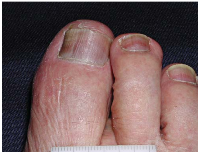
FIGURA 2: Hiperpigmentação ungueal por ciclofosfamida

Tal como a hidradenite écrina neutrofílica, a siringometaplasia escamosa écrina tem apresentação clínica inespecífica, constituída por máculas eritematosas, pápulas e placas papulosas ou vesículas, localizadas ou generalizadas. 35 O aparecimento das lesões ocorre entre dois dias e dois meses após o início da quimioterapia e melhora espontaneamente com a suspensão da(s) droga(s) envolvida(s). 36 O diagnóstico é histopatológico, caracterizado pela presença de metaplasia escamosa das glândulas écrinas na derme papilar. Pode haver necrose mínima e focal do epitélio da glândula écrina, proliferação fibroblástica e edema do estroma periductal. 37 Em oposição à HEN, o infiltrado neutrofílico é mínimo ou ausente. Siringometaplasia écrina escamosa tem sido descrita como achado histológico acidental em outras condições não relacionadas à quimioterapia. 38