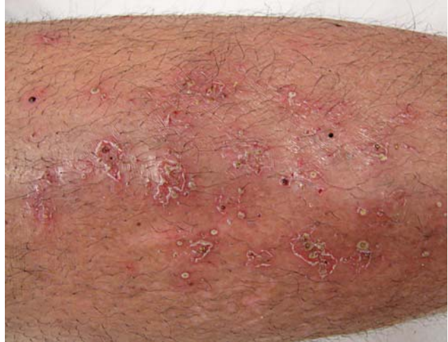
FIGURA 6: Múltiplas pústulas foliculares e descamação interfolicular na face anterior da perna após uso de erlotinibe

Pode ocorrer hemorragia espontânea ou induzida, principalmente, gengival, quando a contagem das plaquetas fica abaixo de 10.000/\text{mm}^3 . Os doentes com maior risco de estomatite são os que apresentam neoplasias hematológicas, doentes menores de 20 anos (alta atividade mitótica do epitélio), doentes com doença oral preexistente e higiene oral precária. Medidas preventivas incluem manutenção adequada da higiene oral por meio de lavagens com água, solução salina, bicarbonato de sódio ou peróxido de hidrogênio. O uso de água fria para prevenir a mucosite induzida por fluorouracil e melphalan