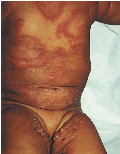
FIGURA 1: Lesões eritemato-edematosas de configuração anular, recobertas por vesículas e bolhas no tronco