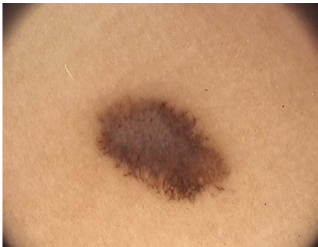
FIGURA 2: Foto da dermatoscopia com aumento de 20x. Padrão global inespecífico, com presença de estrias atípicas (distribuição e dimensões irregulares), presença de rede pigmentar negativa no centro da lesão e áreas lembrando véu branco azulado

O nevo de Spitz é uma lesão incomum, benigna, indolente, geralmente adquirida, acastanhada, plana ou levemente elevada e simétrica. 3 É mais observado em crianças e jovens e raramente em pacientes idosos, sugerindo regressão das lesões com a idade. 4 Apresenta-se, frequentemente, como lesão melanocítica e a dermatoscopia pode aumentar a acurácia do seu diagnóstico, de 46%, a olho nu, para 93% quando usamos a dermatoscopia. 7 Pode apresentar padrões