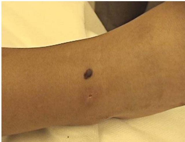
FIGURA 1: Foto clínica. Pápula hiperocrômica com 8mm

global inespecífico, com presença de estrias atípicas associada à presença de rede pigmentar negativa no centro da lesão e áreas lembrando véu branco azulado (Figuras 2 e 3). O exame histopatológico apresentava ninhos de células fusiformes na base epidérmica e na derme (Figura 4).