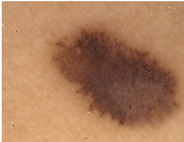
FIGURA 3: Foto da dermatoscopia com aumento de 30x (Fotofinder®)

dermatoscópicos distintos. O padrão mais relevante e peculiar do nevo de Spitz é o estelar ( starburst ), que ocorre em 53% dos casos e tem como características a presença de múltiplas estrias pigmentadas e/ou glóbulos grandes, castanhos ou pretos, distribuídos simetricamente na periferia da lesão, com aspecto radiado. 4 O segundo padrão é denominado globular , que ocorre em 22% dos casos, com a presença de pigmentação central regular acastanhada ou acinzentada e glóbulos acastanhados na periferia. O terceiro padrão descrito por Argenziano et al., que ocorre em 25% dos casos, é o atípico , que se caracteriza por distribuição irregular das estruturas e cores, áreas com pigmentação irregular difusa e véu azul esbranquiçado, e pode, ainda, apresentar estrias radiadas na periferia e padrão vascular pontuado. 7,8