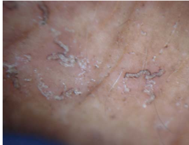
FIGURA 2: Exame dermatoscópico mostrando estruturas acastanhadas triangulares (asa-delta), lesões lineares (sulcos escavados) e imagens semelhantes a gongolôs (diplopoda-símile)

Paciente do sexo feminino, parda, de 58 anos, etilista, portadora de síndrome da imunodeficiência adquirida (sida) com baixa aderência à terapia antirretroviral (TARV). Foi internada em fevereiro de 2008 na enfermaria de sida, apresentando quadro diarreico, desnutrição e lesões crostosas e pruriginosas disseminadas pelo corpo e couro cabeludo, não poupando palmas e plantas, com prurido predominantemente noturno (Figura 1). Inicialmente essas lesões predominavam no couro cabeludo com intensa descamação e prurido, já tendo a paciente feito uso de uma dose de ivermectina oral. A paciente foi colocada em isolamento de contato pela suspeita clínica de SC. Concomitantemente, apresentava lesão herpética no lábio e candidíase oral. Os parâmetros imunológicos mostravam diminuição dos linfócitos CD4 (480 células por mm 3 em outubro de 2007 versus 22 células por mm 3 em março de 2008). A carga viral mostrou-se indetectável. Assim que foi admitida, foi reiniciada TARV com lamivudina, efanvirenz e DDI. Feita a dermatoscopia (Dermalite Pro II) com um aumento de 10x, evidenciou-se a presença de estruturas diplopoda-símile, sulcos escabióticos e estruturas acastanhadas em asa-delta (Figura 2), tendo sido ratificado o diagnóstico pelo exame parasitológico das escamas cutâneas clarificadas com solução de hidróxido de potássio a 10%, que revelou numerosos parasitas e ovos (Figura 3).