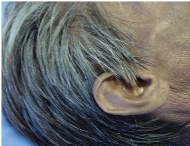
FIGURA 4: Melhora clínica significativa após 14 dias de tratamento

parasita). A dermatoscopia possibilita a identificação dos sulcos escavados, bem como a detecção dos parasitos, que ao método apresentam-se como triângulos acastanhados em forma de asa-delta, que correspon-