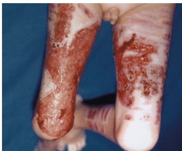
FIGURA 1: Ulcerações fagedênicas de contornos irregulares e fundo eritematoso localizadas na face anterior das coxas

No presente caso, o PG foi observado em criança com cinco anos de idade, vítima de queimaduras, e mostrou certas singularidades. Primeiramente, ressalta-se o fato de que as lesões surgiram nos membros inferiores, e não nas regiões preferenciais da doença