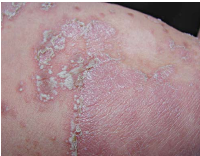
FIGURA 5: Placas eritematosas ainda com pústulas margeadas, após 3 meses de tratamento

Nesse relato, o paciente apresentava história familiar de lesões semelhantes, o que corrobora o importante papel da hereditariedade na psoríase. 4 Possíveis diagnósticos diferenciais incluem: a síndrome da pele escaldada estafilocócica, síndrome de