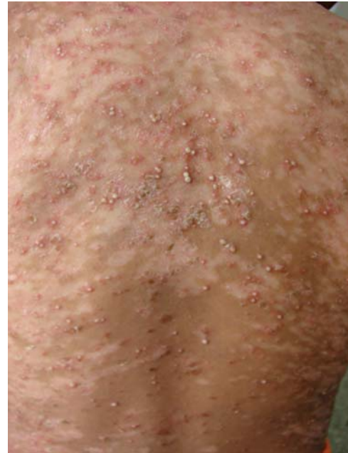
FIGURA 6: Lesões hipocrômicas residuais com pústulas esparsas