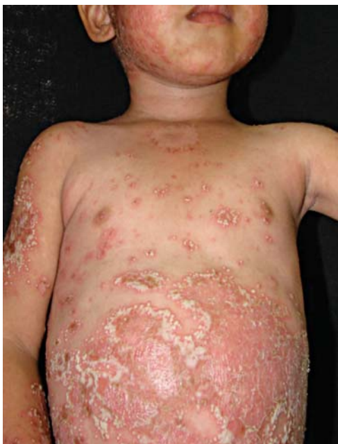
FIGURA 1: Placas eritematosas, descamativas margeadas por grande quantidade de pústulas no tronco

O paciente foi medicado com dapsona 5mg, de 12 em 12 horas, e sulfato ferroso 10ml por dia. Evoluiu em três meses, com perda de peso, após suspensão do corticoide tópico, resolução da febre e melhora da adinamia. Ainda houve regressão parcial das lesões citadas acima, porém evidenciando-se ainda surgimento de novas lesões. Apresentava pústulas, com base eritematosa no dorso, abdômen e tórax (Figuras 5 e 6). A dapsona foi mantida, sendo programada a introdução de ciclosporina, caso não houvesse resposta satisfatória ao tratamento corrente.