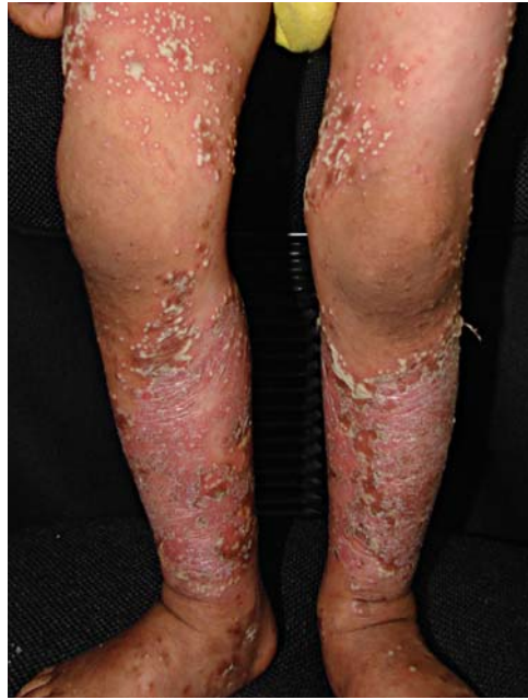
FIGURA 2: Placas descamativas com numerosas pústulas, sobrepostas nos membros inferiores (HE; 100x)

O exame anatomopatológico evidenciou vesícula subcórnea mantendo exsudato fibrino-leucocitário, na luz e epiderme, mostrando acantose, com discreta hiperqueratose e pequenas áreas de paraceratose; na derme havia infiltrado mononuclear com agrupamentos de neutrófilos (Figuras 3 e 4). Esse resultado foi compatível com a suspeita clínica de psoríase pustulosa.