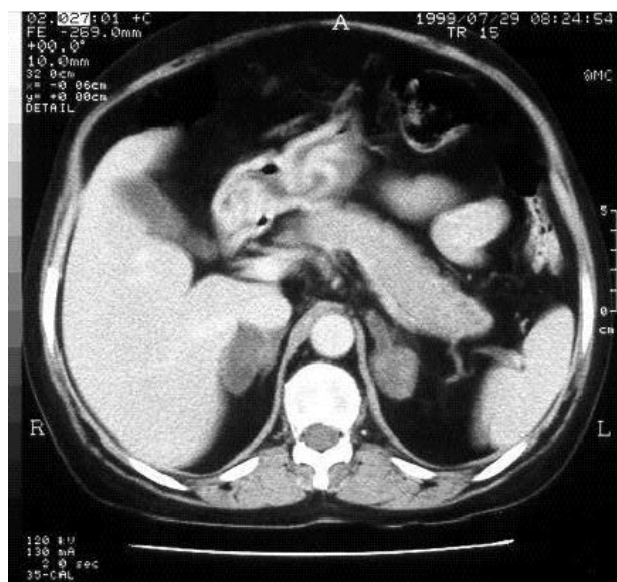
Figura 1. Tomografia computadorizada das adrenais de paciente com Síndrome de Cushing independente de ACTH: aumento nodular bilateral das adrenais.

O exame microscópico das adrenais revelou que os nódulos eram compostos por células claras, aparentemente com gordura, que apresentavam monotonia nuclear, características típicas das células do córtex adrenal. Chamava a atenção a presença de pequenas ilhotas de células compactas no meio dessa população de células claras, que possuíam núcleo mais vesiculoso e nucléolo proeminente, dados indicativos de maior replicação ou maior atividade de síntese celular (figura 2). Verificamos que o tecido internodular se apresentava hiperplásico, nas duas adrenais. O estudo imunohistoquímico da cortical, que nós temos realizado sistematicamente a partir de