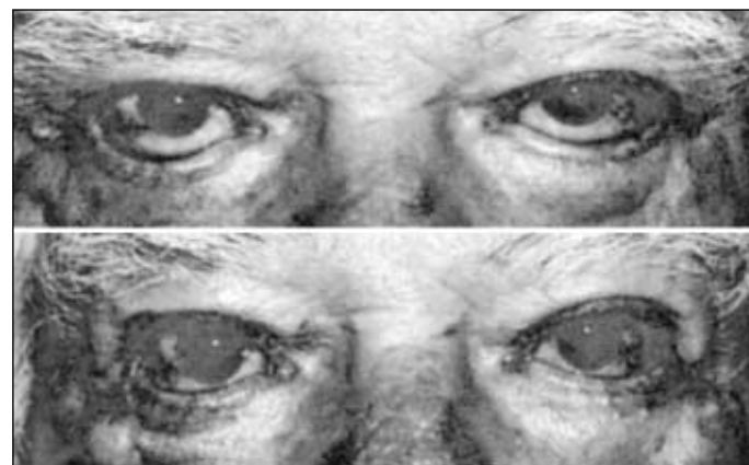
Figura 4 - Observar na figura superior, a presença do ectrópio palpebral bilateral. A figura inferior mostra o paciente no pós-operatório, com manutenção do ectrópio cicatricial e marcas visíveis da sutura de fixação feita com o nylon. O paciente foi submetido também à elevação do supercílio