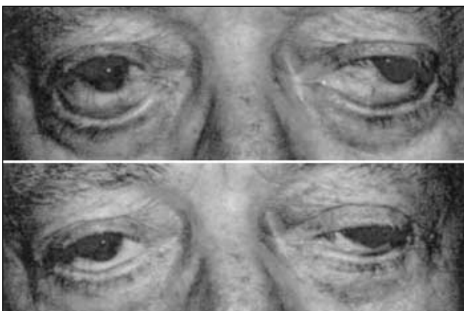
Figura 2 - Observar na figura superior, a presença do ectrópio palpebral cicatricial bilateral e na inferior o reposicionamento palpebral. O paciente apresenta também ptose e exotropia