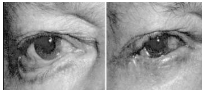
Figura 3 - Observar a esquerda, intenso ectrópio cicatricial, com exposição da conjuntiva tarsal e bulbar. Na figura da direita, o reposicionamento palpebral após a cirurgia do "midface lift", associado ao "tarsal strip"