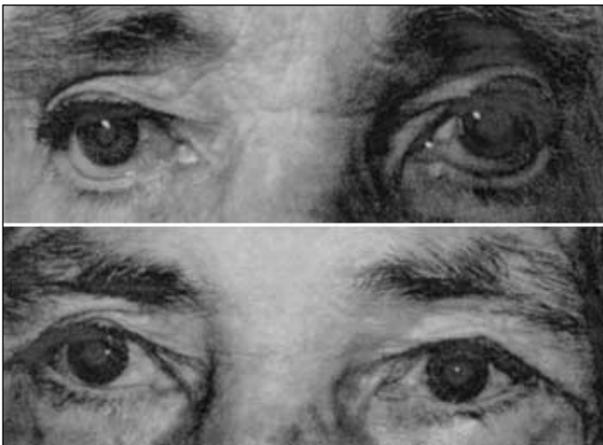
Figura 1 - Observar na figura superior, a presença do ectrópio palpebral bilateral e na inferior o reposicionamento palpebral