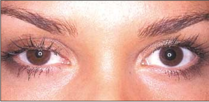
Figura 1 - Ptose mínima à direita