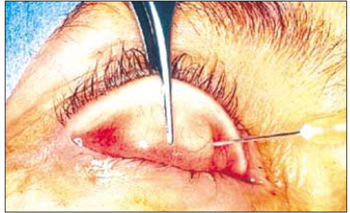
Figura 3 - Infiltração conjuntival

A intervenção pode ser realizada sob anestesia local ou geral, sendo esta última indicada para crianças. Injeção de lidocaína a 2% com adrenalina a 1: 200 000 é feita no subcutâneo da pálpebra superior (PS), logo acima da margem palpebral. Após sua eversão com a ajuda de um fio de tração, seda 4-0, passado acima da margem palpebral e um retrator de Desmarres, nova infiltração é realizada na conjuntiva logo acima do tarso (Figura 3). Incisão da conjuntiva em toda extensão horizontal da base superior do tarso é realizada com bisturi lâmina 15 e dissecação superiormente em bloco do MM e da