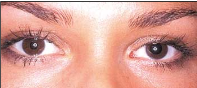
Figura 2 - Elevação palpebral após instilação de fenilefrina 10%