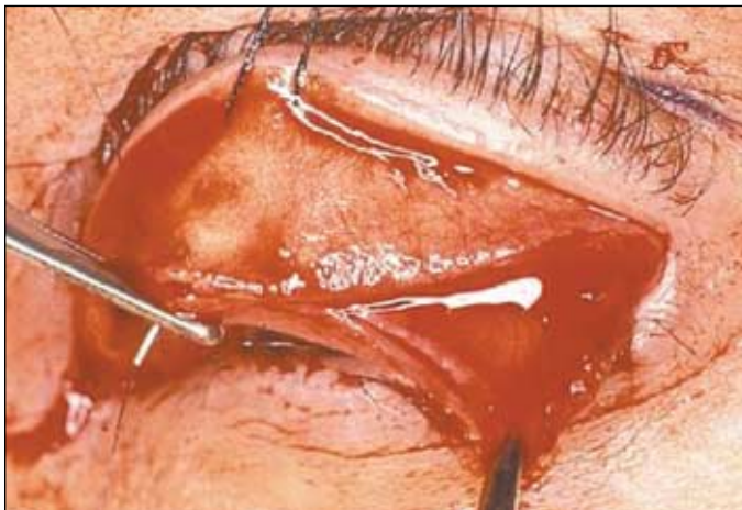
Figura 6 - Sutura contínua unindo tarso, músculo de Müller e conjuntiva

Em casos de hipocorreção no pós-operatório imediato, as extremidades da sutura foram tracionadas, elevando-se a margem palpebral superior, melhorando o resultado cirúrgico. Nos casos de hipercorreção, deve-se realizar uma tração na pálpebra superior para baixo, podendo ser feita com a ajuda de um fio de tração, seda 4-0, na borda palpebral nas primeiras 48h (3-4) .