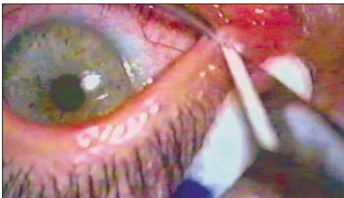
Figura 1 - Apreensão da papila com pinça de dente e incisão de todo seu contorno com lâmina 11