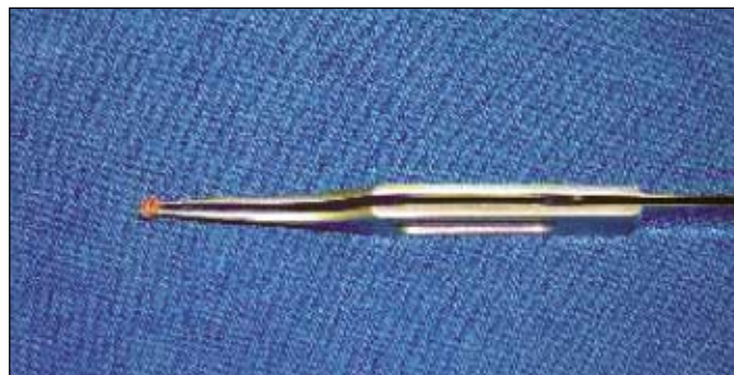
Figura 3 - Figura mostrando o segmento do canalículo removido

fobia, houve melhora nos dois pacientes que a relatavam antes do procedimento, embora este sintoma tenha sido mais expressivo em um deles. A vermelhidão ocular presente em todos os casos antes do procedimento, apresentou-se no final do acompanhamento, apenas como uma vasodilatação mínima.