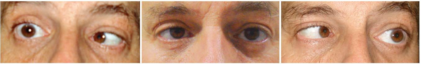
Figura 1. Motilidade ocular extrínseca apresentava paresia reto lateral bilateral.