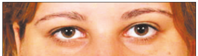
Figura 3 - Ortotropia após 5 meses de suspensão da tetraciclina

sem edema, apenas com dobras retinianas peripapilares, sendo suspensa a medicação. Em 03/02/2004, a paciente apresentava acuidade visual de 20/20p em AO com correção. Na fundoscopia apresentava olho direito sem alterações e olho esquerdo com discreta palidez de papila em quadrante temporal.