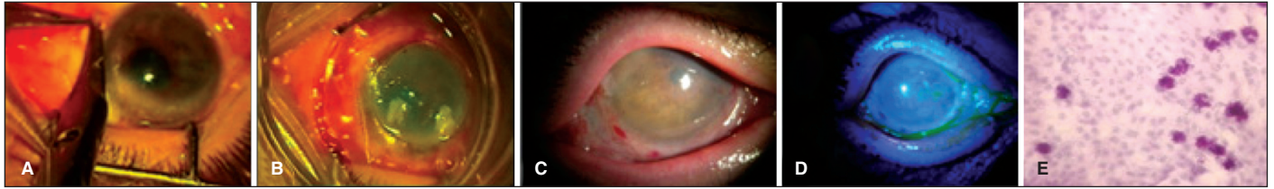
Figura 2. A) Pré-operatório da paciente apresentando deficiência límbica total; B) Peroperatório mostrando colocação MA colonizada ex vivo por células epiteliais límbicas alógenas; C) e D) Aspecto pós-operatório de 1 mês evidenciando completa reepitelização; E) Citologia de impressão no pós-operatório de 3 meses evidenciando recidiva de células calciformes na superfície corneana

sultados variáveis a curto prazo (1 a 2 anos de seguimento), variando de 46% a 100% de sucesso na reconstrução da superfície ocular em casos de DCTL (5,8-9) .